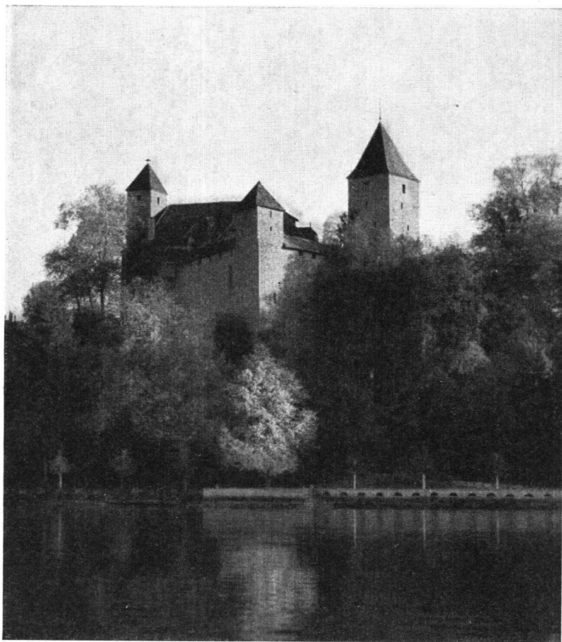
Die Burg von Norden. Aufnahme von 1948

Wir richten nun die freundliche Bitte auch an unsere Mitglieder, mitzuhelfen, das Schloß Rapperswil in sachgemäßer Weise zu restaurieren.