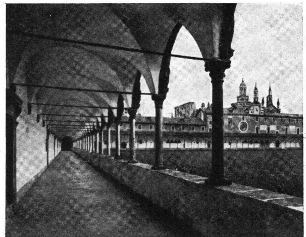
Certosa von Pavia

In den entsprechenden Kosten sind enthalten: Alle Veranstaltungen, Autofahrten ab Zürich und nach Zürich zurück, Unterkunft und Verpflegung in Hotels und Restaurants (ohne Getränke bei den Mahlzeiten), Bedie-