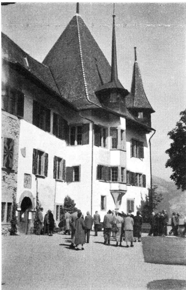
Im Garten vor dem Schloß Spiez.

An die Jahresversammlung schloß sich eine vom schönsten Wetter begünstigte 2½tägige Fahrt ins Berner Oberland zu den Schlössern Thun, Burgstein, Oberhofen und Ringgenberg am Brienersee. Die bisher nur sehr wenig bekannte Wasserburg Weissenau am Einfluß der Aare in den Thunersee (vgl. Nr. 2, Jahrg. 1954, S. 43) ist in den letzten Jahren von der allzu stark die Umgebung überwuchernden