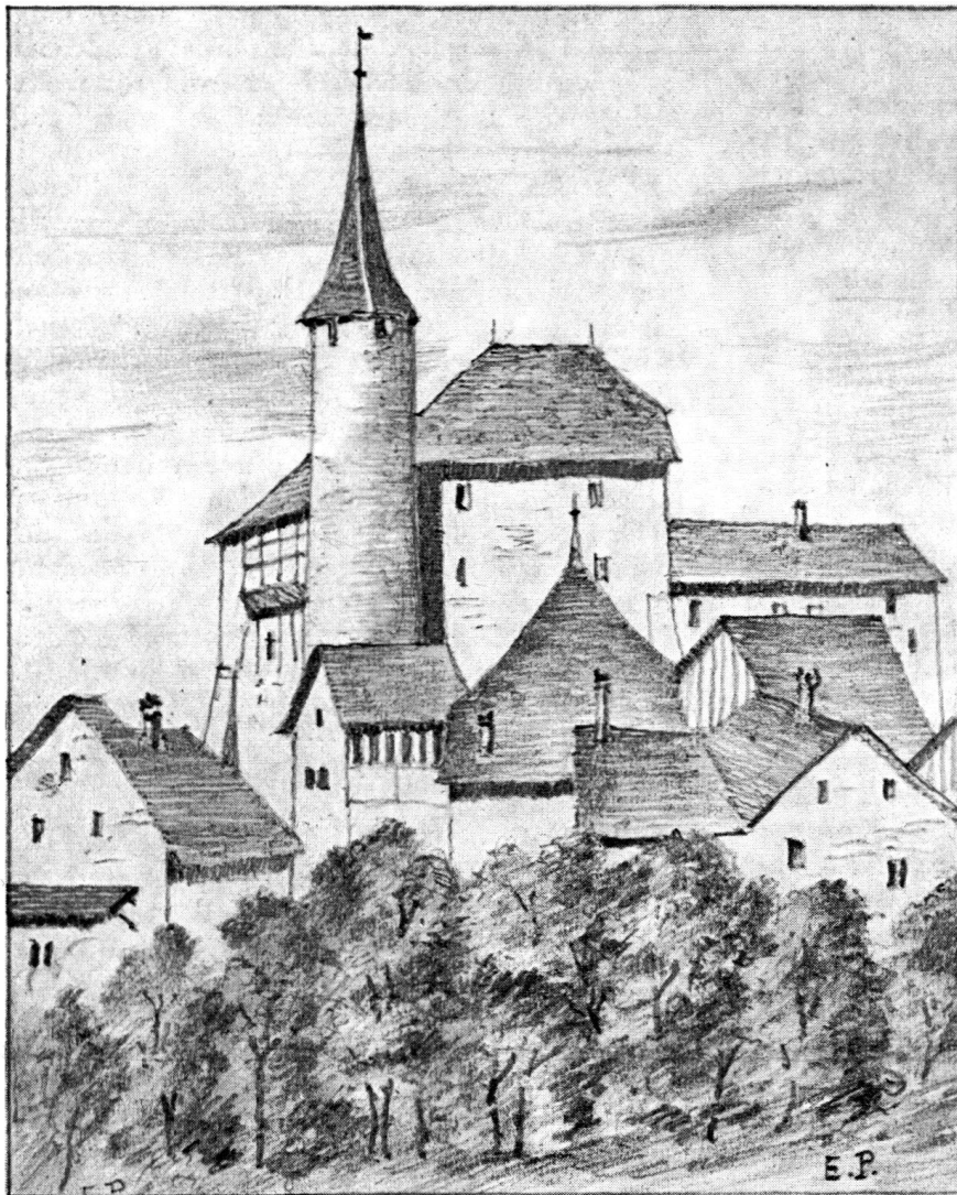
Boudry, wie es heute aussieht