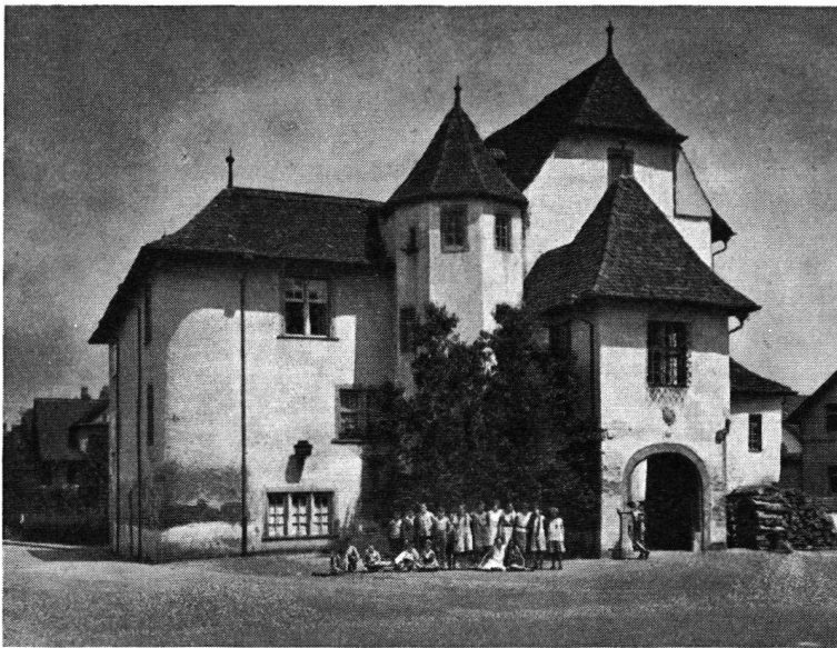
Das Weiherschloß Pratteln Anno 1932

das vernachlässigte Schloß hingegen präsentiert sich innerhalb der modernen Häuserzeilen immer schäbiger und bedarf einer gründlichen Restauration, wenn es nur einigermaßen ein zum großen Industrieort passendes Wahrzeichen bleiben soll. Auf dem Wartenberg und auf Schauenberg hat man die auf unser Dorf herunterschauenden Schloßruinen sorgfältig konserviert, obwohl sie fast im Erdboden verschwunden waren und nicht mehr bewohnbar sind. Pratteln dagegen besitzt noch den verhältnismäßig gut erhaltenen Kern der weiträumigen Weiherschloßanlage, und aus den Bildern von Emanuel Büchel ersehen wir ihre frühere Schönheit und imponierende Gestaltung.