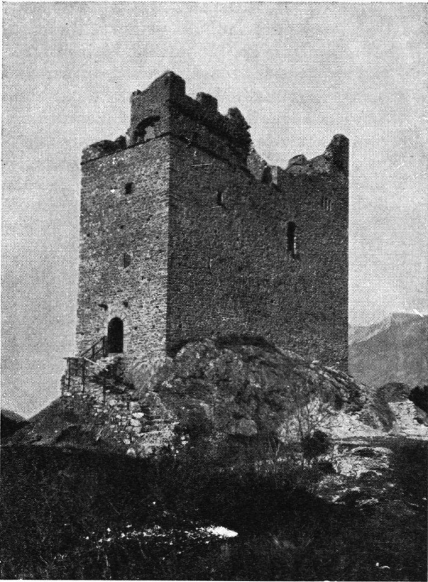
Burgruine Wartau bei Sevelen

Teilnehmerkarte A: Kat. I Hof Ragaz. Teilnehmerkarte B: Kat. II Flora, Lattmann, Tamina