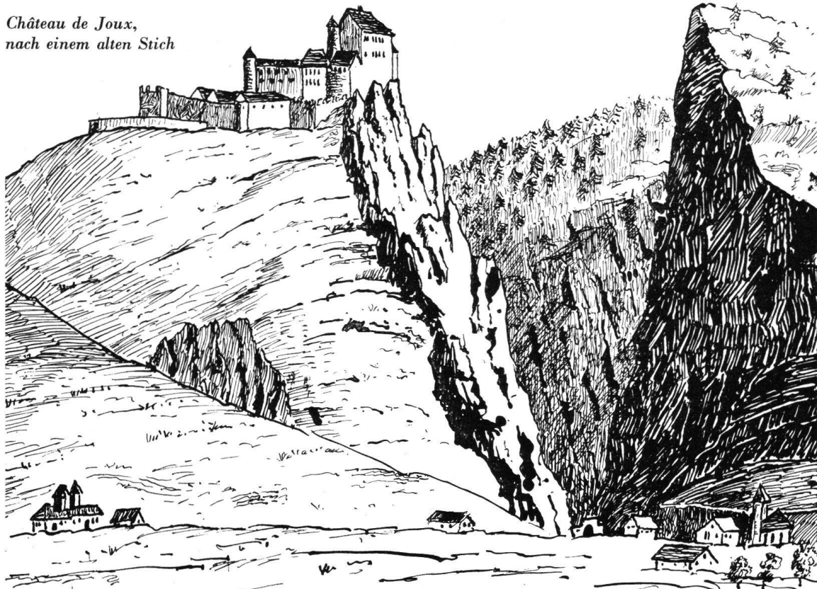
Château de Joux, nach einem alten Stich

Cette visite du Château de Joux possède un sommet. Ce qui est d'ailleurs une façon de parler, car ce sommet se trouve à 140 mètres sous terre. Il s'agit d'un puits. Du puits le plus incroyable de toute la région et même de bien au delà. Il a quatre mètres de diamètre, ce qui est déjà énorme. Mais surtout il a 142 mètres