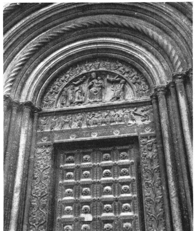
Parma, Baptisterium, Skulpturen von Antéلامي