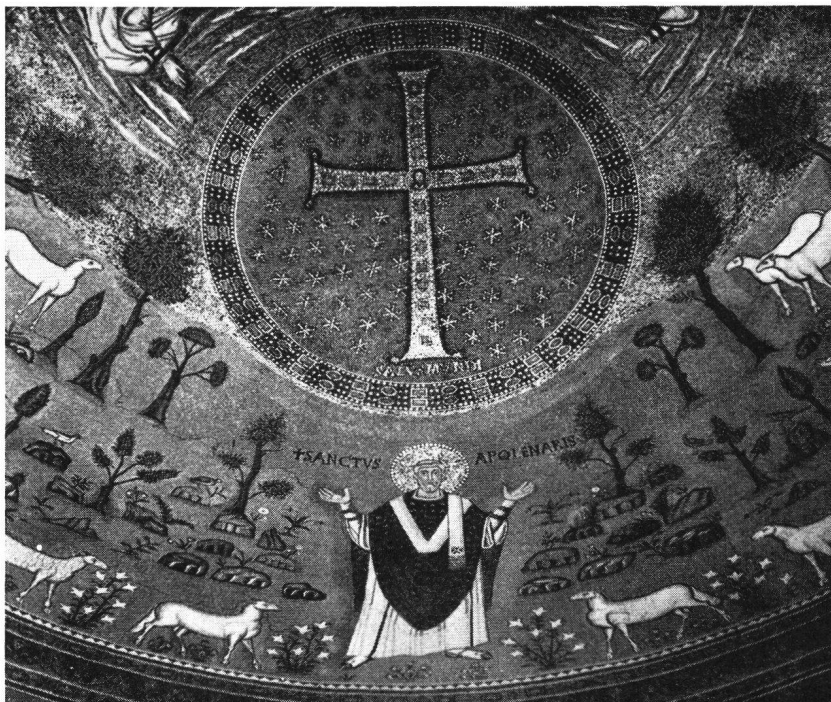
Ravenna, S. Apollinare in Classe, Apsis

Einen letzten, krönenden Akzent, ehe man nach Mailand und kurz danach in die heimatlichen Gefilde zurückkehrte, setzte der in allen Teilen gelungenen Reise ein Besuch in der Herzogs- und Festungsstadt Mantua; das gewaltige, aus verschiedenen Baukörpern sich fügende Gonzaga-Schloß entfachte dort als Ganzes so sehr das Interesse, wie die Ausschmückung einzelner Gemächer, vor allem jene der berühmten «Camera degli Sposi» durch den genialen Mantegna, Begeisterung weckte.