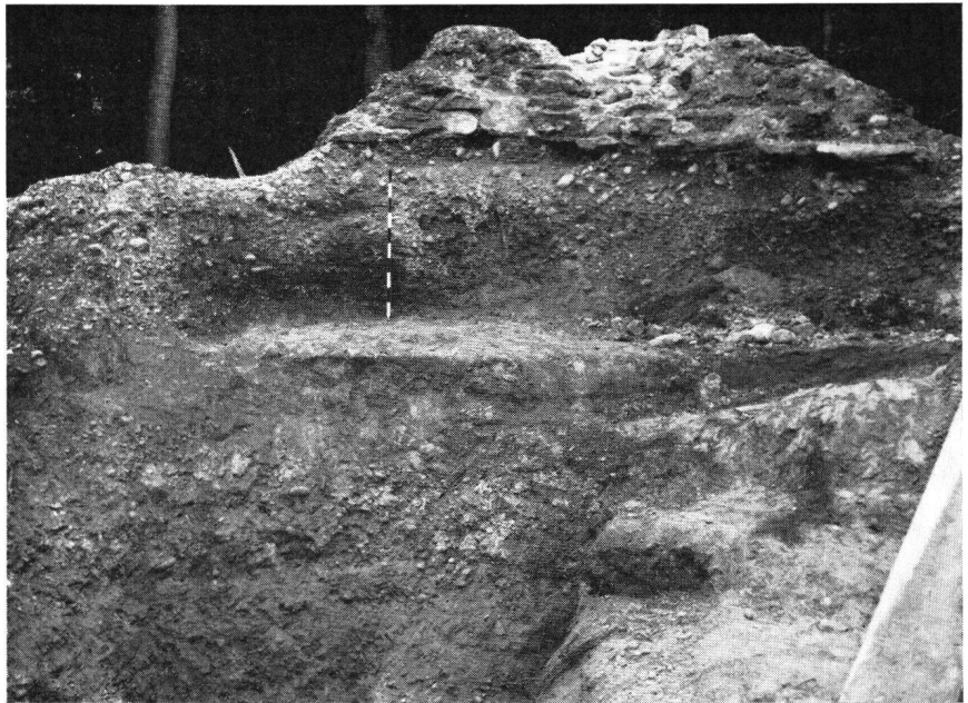
Oben: Rest der «Schildmauer» auf abgeschrotetem Nagelfluhfels, Hasenburg. Unten: Mauer des Hauptgebäudes auf abgeschrotetem Sandstein, Hasenburg