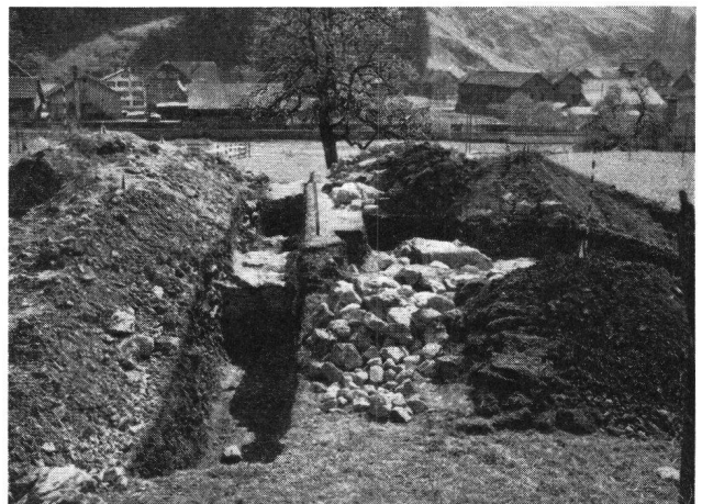
Ahaburg, Sondierschnitt durch die Turmfundamente

Wer annimmt, daß die Burgen und festen Häuser der Urschweiz, die ja mit der Entstehungsgeschichte der Eidgenossenschaft aufs engste verbunden sind, erforscht seien, ist weitab von der Realität. Wohl kaum eine Gegend der Schweiz ist wie das Kantonsgebiet von Schwyz diesbezüglich Brachland. Deshalb entschloß