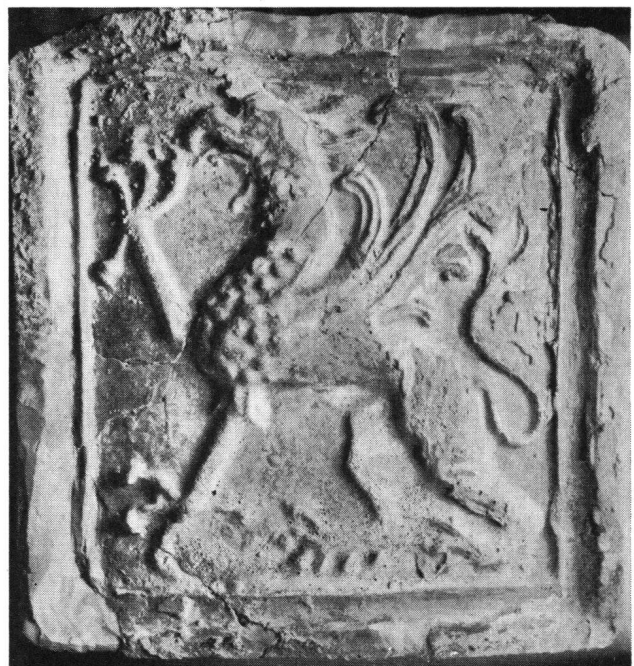
Sternenbergr SO. Grün glasierte Blattkachel aus dem Wohnturm

Das ausgegrabene Mauerwerk ist konserviert worden und soll dem Publikum zugänglich gemacht werden. Über die Arbeiten ist eine eingehende Publikation in den «Jurablättern» in Vorbereitung. Werner Meyer