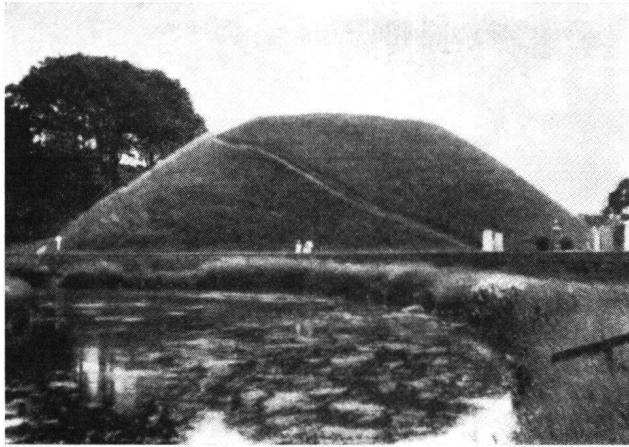
Die Motte von Inverurie. Aberdeenshire, ca. 1180