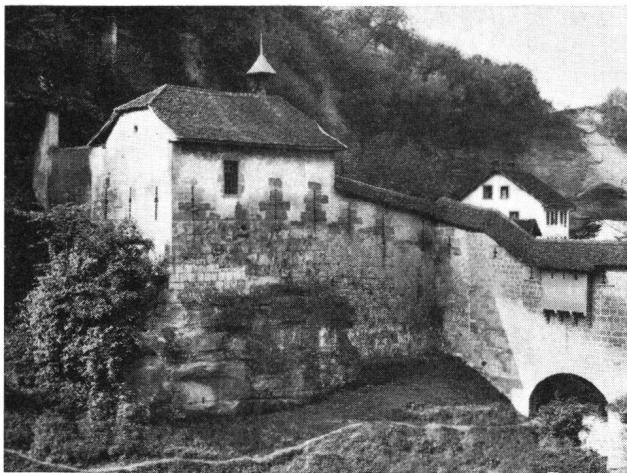
Freiburg Ringmauer. Kapelle St-Béat, nach der Restauration 1937.

au milieu du XIII e siècle. Il estime que c'est un fait remarquable de voir apparaître à Fribourg à cette époque un dispositif de défense qui ne s'est répandu en Europe qu'à la fin de ce siècle. Zemp écrit (op. cit.) que la tour du Durrenbühl a été construite à la fin du XIV e siècle, peut-être en utilisant les fondations d'une tour antérieure.