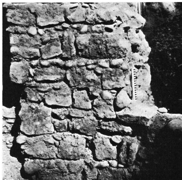
St. Albanvorstadt Basel, Innenmantel des Schalenturmes

Die Befestigung bestand aus einem acht Meter breiten und fast fünf Meter tiefen Trockengraben, und