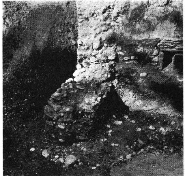
Basel, St. Alban-Vorstadt 36. Fundament des Schalenturmes

kleinen Kieseln ausgeflickt. Also ein typisches hochmittelalterliches Mauerwerk. Die wenigen Funde, welche in der Baugrube gemacht wurden, wiesen auf das 13. Jahrhundert als Entstehungszeit hin.