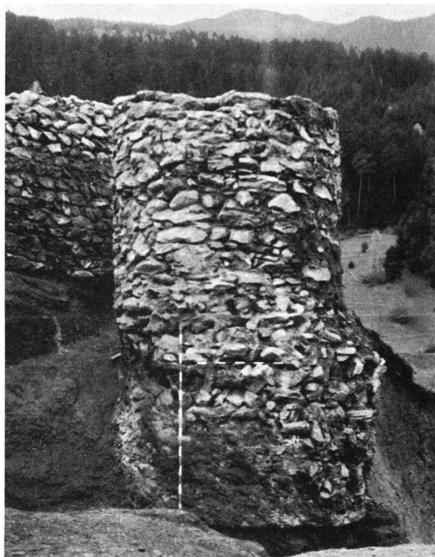
Burg Nieder-Realta GR Zisterne während der Ausgrabungen 1960

Wir entnehmen einer Mitteilung von Dr. Erb folgendes: «Durch die bisherigen Ausgrabungen konnten im ganzen die nördliche Hälfte des Burggrundrisses festgestellt und schätzungsweise ein Drittel der Kulturschichten untersucht werden. Als Resultat ergibt sich ein älterer Teil der Burganlage mit verschiedenen