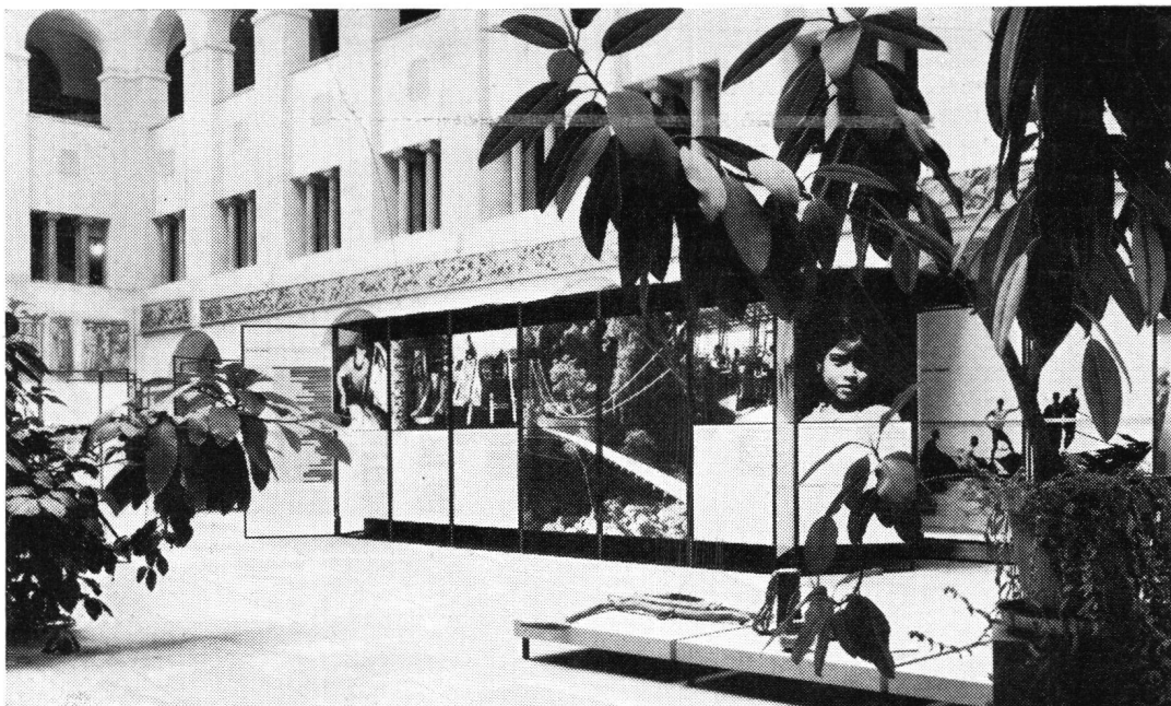
von der Vernissage im Lichthof der Universität Zürich

Auf Lenzburg schlußendlich, wo uns dessen Betreuer, Dr. H. Dürst, eingehend mit der Geschichte des mächtigen Grafensitzes vertraut machte, bot sich Gelegenheit, in die Aufbauprobleme eines vor kurzem gegründeten historischen Museums Einblick zu nehmen. Daß beim anschließenden schmackhaften Abendessen im Rittersaal die Stimmung bald hohe Wellen schlug, braucht wohl kaum extra erwähnt zu werden.