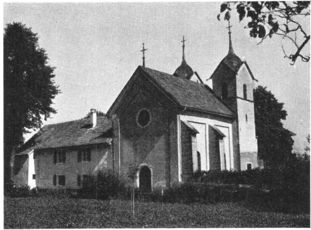
Böttstein AG, Schloßkapelle

Böttstein, unser erstes Ziel, darf wohl unstreitig als der eingangs erwähnte Idealfall gelten. Der heute noch herrschaftliche Edelsitz gehört seit einigen Jahren un-