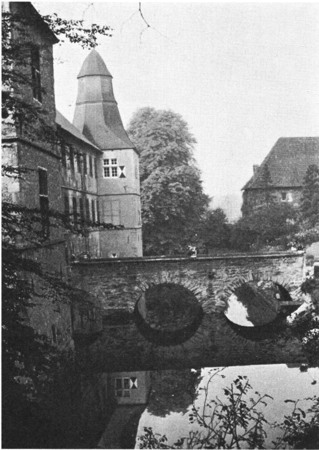
Westerwinkel Westfalen, Schloß

lung wird er unsere Erinnerungen an die gelungene Burgenfahrt 1963 nach Westfalen nochmals aufleben lassen.