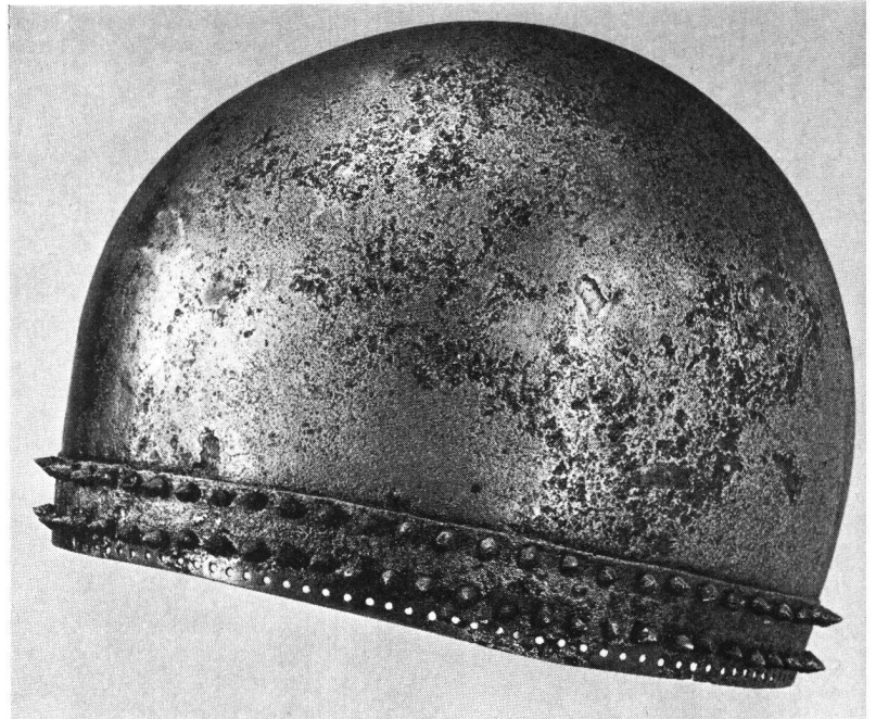
Niederrealta GR Helm, ergänzt und konserviert

Erscheinen jährlich sechsmal XXXVII. Jahrgang 1964 6. Band November/Dezember Nr. 6