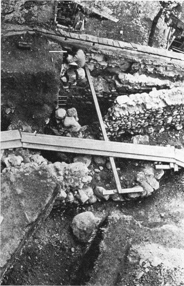
Zug Burg. Blick vom Bergfried gegen Südosten, Grabungsfeld 4. Von vorne nach hinten erkennen wir: Fundamente der frühesten Palasmauer; Erste Ringmauer; erweiterte Ringmauer; Verstärkung der erweiterten Ringmauer.

Bauanalyse gewonnen werden. Insbesondere ist man heute auch in der Lage, die zukünftigen Niveaus innerhalb und außerhalb der Burg absolut festzulegen und zu bestimmen, welche Mauerzüge dem zukünftigen Besucher des Museums sichtbar bleiben sollen.