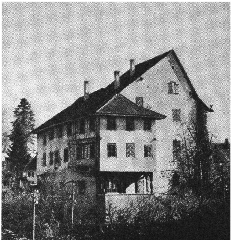
Zug Burg. Ansicht von Norden. Der Palas (links) wurde im 16. Jh. auf dem Mauerwerk eines früheren Baues in vorkragender Konstruktion aufgestockt. Rechts Bergfried mit später aufgesetztem Giebel. Seine ursprüngliche Höhe reichte bis zum Kranzgesimse.

Erscheinen jährlich sechsmal XL. Jahrgang 1967 7. Band Sept./Okt. Nr. 5