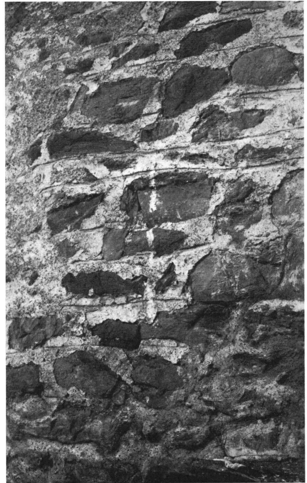
Gräpplang bei Flums SG. Burgruine. Romanischer Verputz am Palas mit den rot bemalten Chellenstrichfugen.

Nach dem Einsturz des Palas des Schlosses im Jahre 1459 wurde im folgenden Jahr das sogenannte Hintere Schloß auf der Südostseite des Bergfrieds erweitert und für Wohn- und Wirtschaftszwecke ausgebaut. In den sechziger Jahren des letzten Jahrhunderts sind diese Trakte zufolge Baufälligkeit abgetragen worden. Das die beiden Terrassen umschließende Mauerwerk bildete den Unterbau dieser Gebäulichkeiten. Die Ansatzstellen des Satteldaches dieses Baues sind am