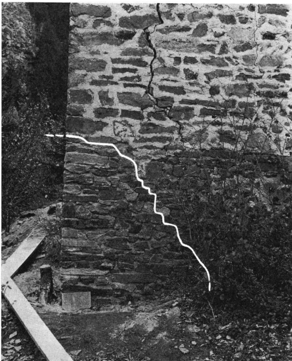
Hohenrätien GR. Burgruine. Südostturm. Unter dem weißen Strich die eingemauerte Ecke. Hier war der Einsturz der ganzen Ostwand zu befürchten (man beachte den klaffenden Riß). Die Fugen werden im Frühjahr mit Kalkmörtel ausgestrichen, um dem ergänzten Mauerwerk den gleichen Farbton zu geben. Aufnahme Oktober 1970. (Die weißen Linien sind am Objekt markiert)