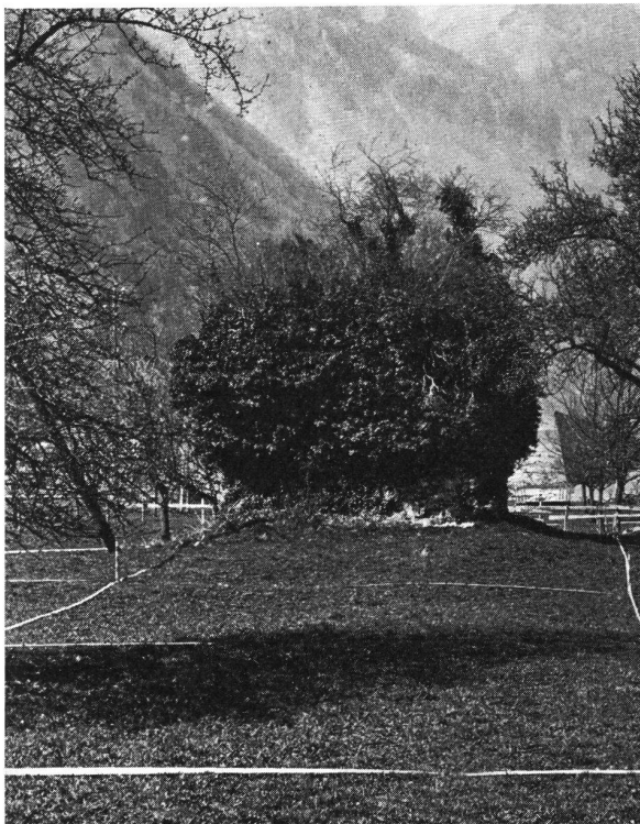
Seedorf UR Burgruine. Ansicht von Südosten. Die bescheidene Anlage ist heute fast vollständig von Strauchwerk und Efeu überwachsen.

Die Überreste der ehemaligen Burg Seedorf gegenüber der Pfarrkirche der gleichnamigen Gemeinde liegen westlich der Straße nach Bauen in einer leicht nach Norden fallenden, mehr oder weniger ebenen Wiese. Die fast ganz von Efeu überwucherte Turmruine hat noch eine Höhe von rund 5 Metern. Der Grundriß ist quadratisch und weist Seitenlängen von 6,6 Metern auf. Die Mauern, deren Zustand bedenklich ist, sind um 2 Meter mächtig. Rund um den ganzen Bau fehlen von der heutigen Erdoberfläche bis in eine Höhe von etwa 2,5 Metern die Steine der äußeren Schale; das Füllwerk liegt hier frei und ist der Erosion