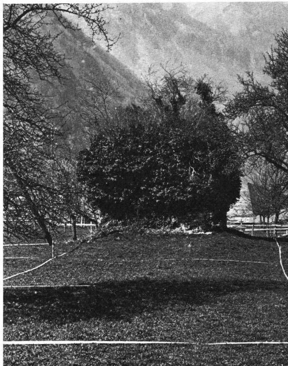
Seedorf UR Burgruine. Ansicht von Südosten. Die bescheidene Anlage ist heute fast vollständig von Strauchwerk und Efeu überwachsen.

Die Überreste der ehemaligen Burg Seedorf gegenüber der Pfarrkirche der gleichnamigen Gemeinde liegen westlich der Straße nach Bauen in einer leicht nach Norden fallenden, mehr oder weniger ebenen Wiese. Die fast ganz von Efeu überwucherte Turmruine hat noch eine Höhe von rund 5 Metern. Der Grundriß ist quadratisch und weist Seitenlängen von 6,6 Metern auf. Die Mauern, deren Zustand bedenklich ist, sind um 2 Meter mächtig. Rund um den ganzen Bau fehlen von der heutigen Erdoberfläche bis in eine Höhe von etwa 2,5 Metern die Steine der äußeren Schale; das Füllwerk liegt hier frei und ist der Erosion