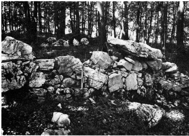
Bürklen bei Netstal GL, Bering aus Trockenmauerwerk