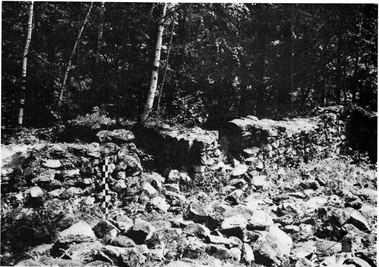
Burgstelle Sola GL.