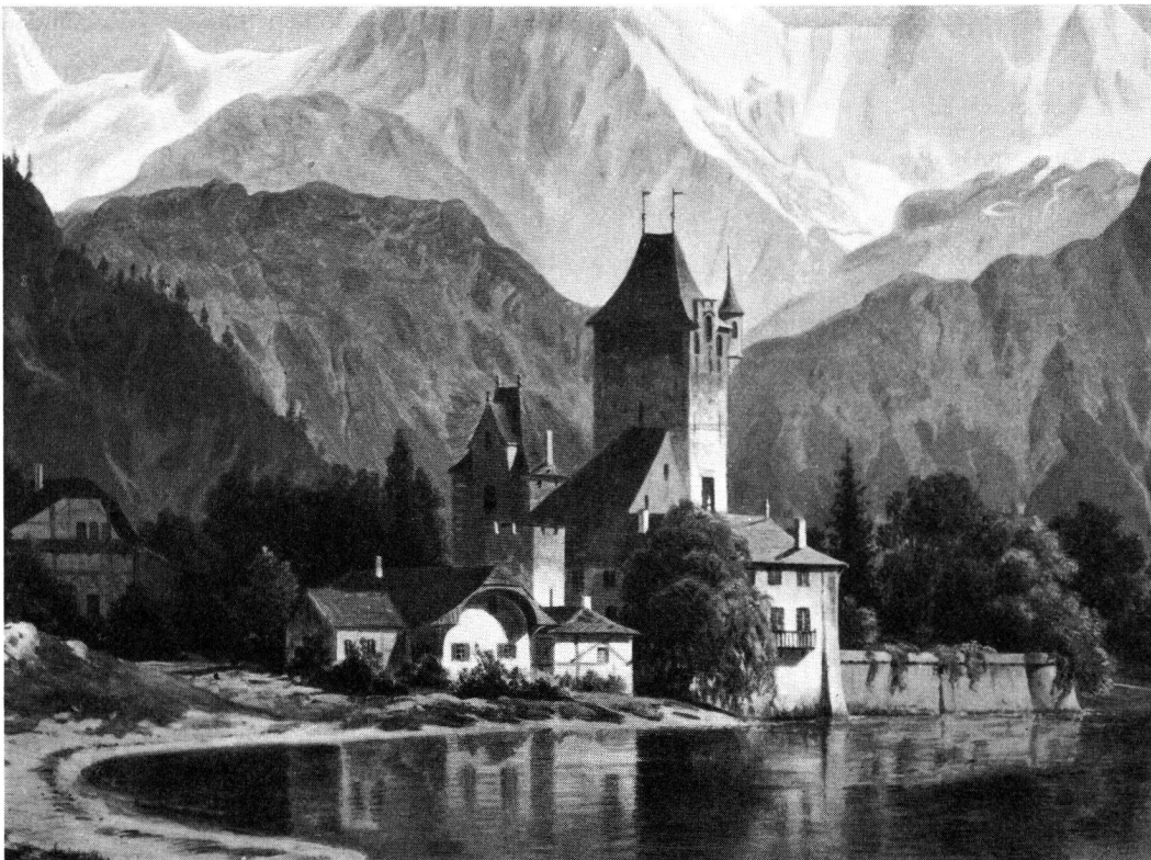
Schloss Oberhofen, nach einer Abbildung aus dem 19. Jahrhundert