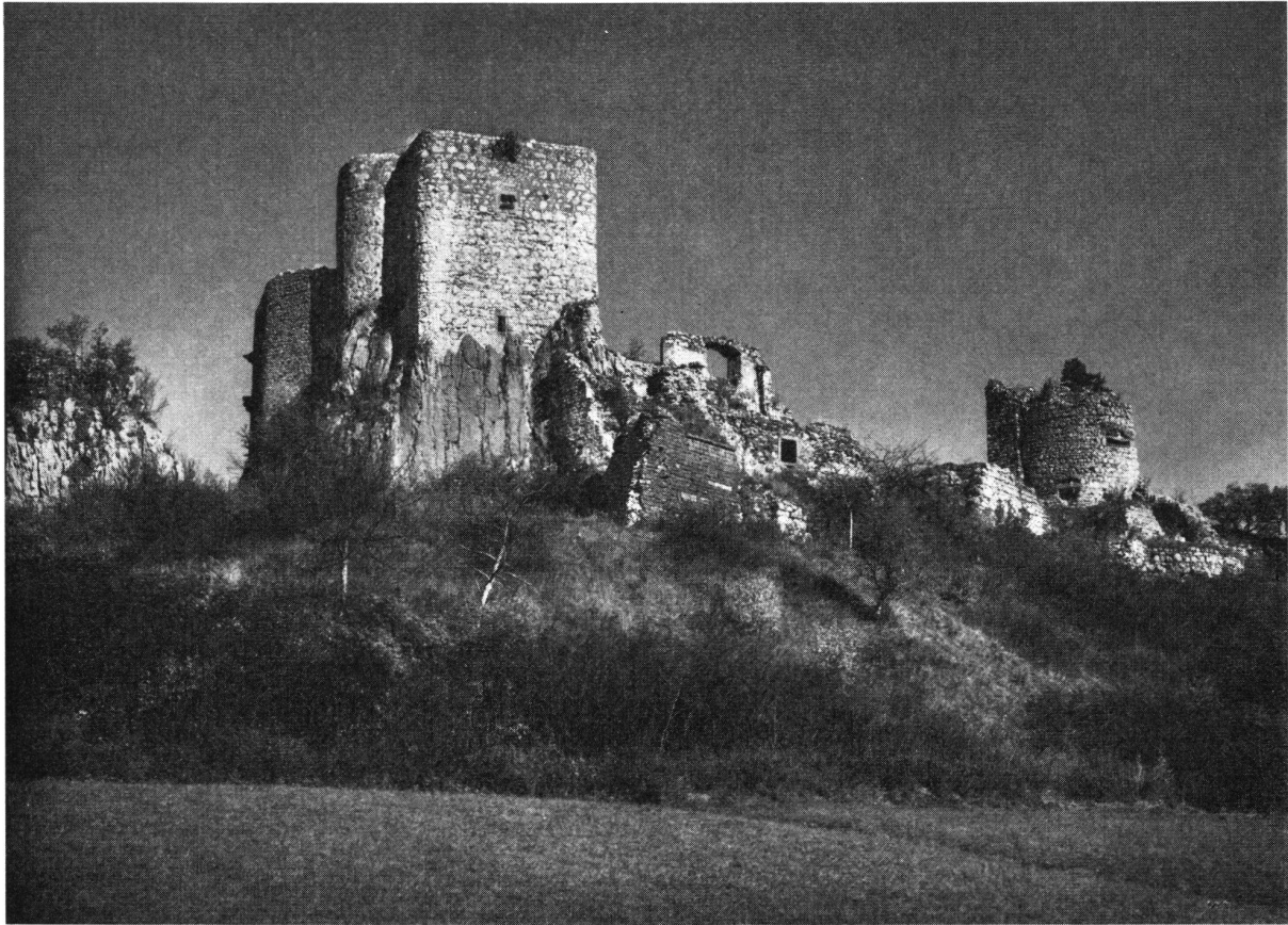
Landskron, Anblick von Südwesten. Wohnturm (13. Jahrhundert), Erweiterungsbauten (um 1515) und Trümmer der französischen Festung (Ende 17. Jahrhundert)