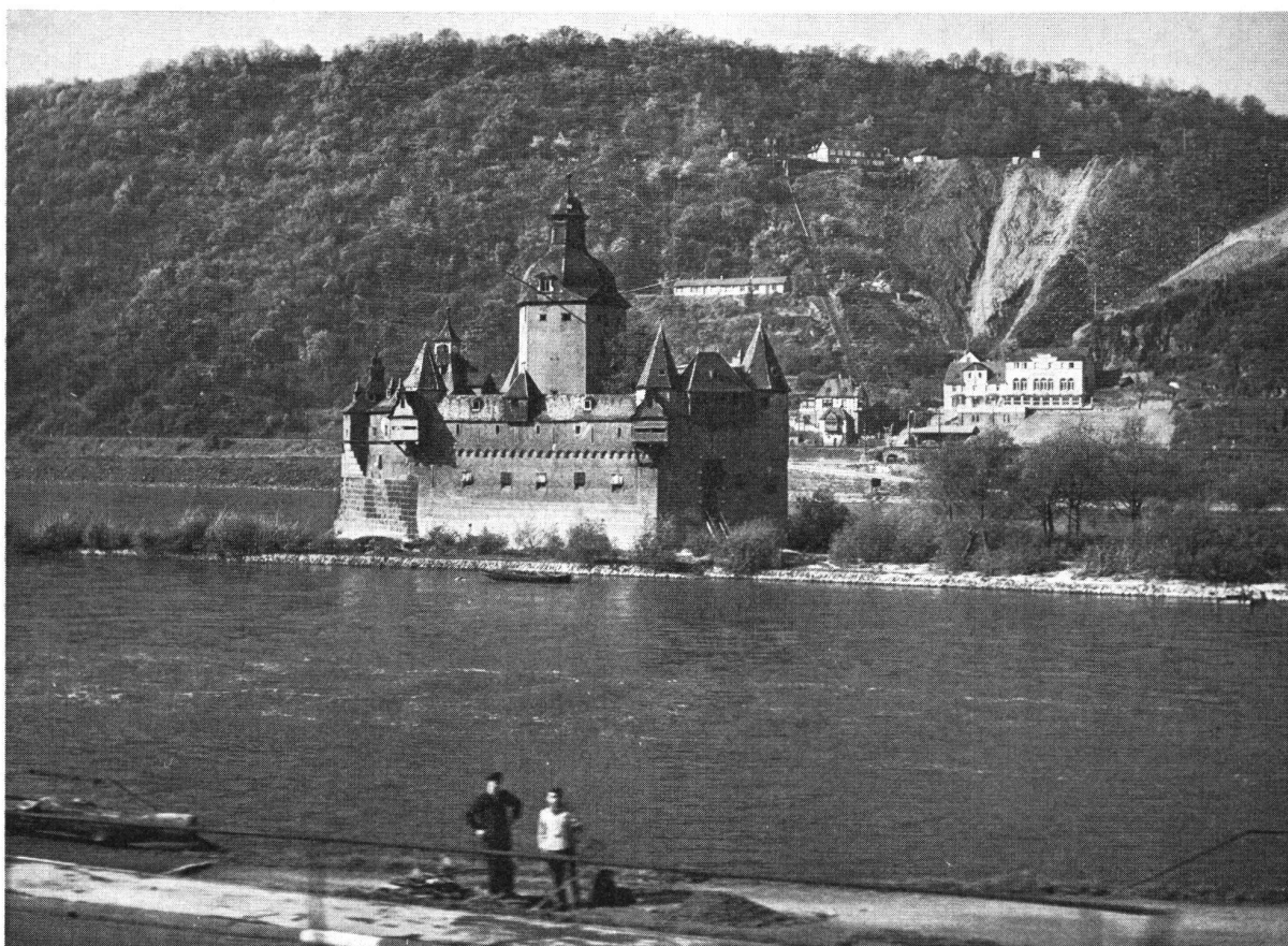
Pfalz bei Kaub

nich bei Beilstein. Ein Stück weit, bis Cochem, Fahrt auf der Mosel per Schiff oder für die, welche es wünschen, Fahrt im Car nach Cochem und Besuch der Burg, die nur in steilem Aufstieg zu Fuss erreichbar ist und deren Einrichtung hinter jener anderer besichtigter Objekte zurücktritt. Der Tag wird mit dem Besuch des Schlosses Pyrmont (Privatsitz) und der Rückfahrt ins Hotel beendet.