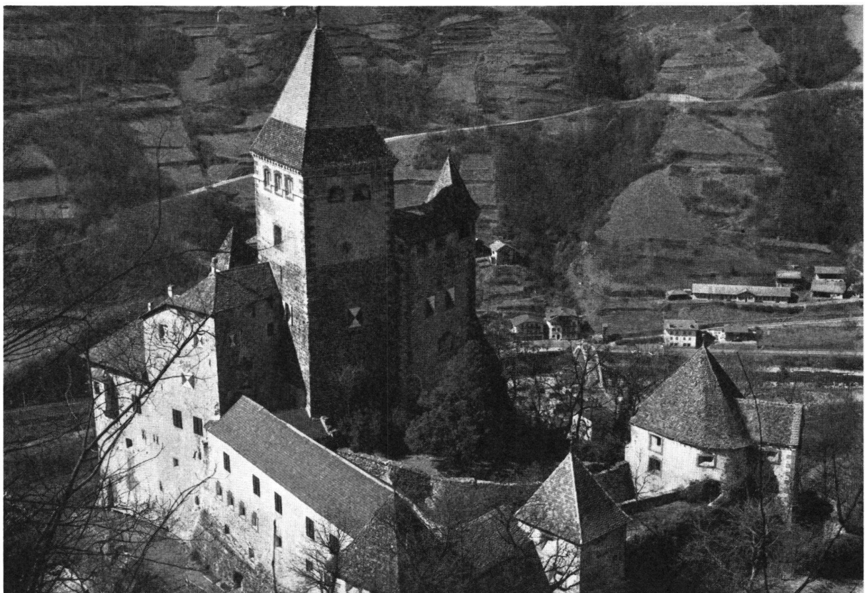
Die Trostburg wurde um 1600 in eine moderne Festung umgewandelt, die den Feuerwaffen standhalten sollte. Erst im Zweiten Weltkrieg richteten Kanonenschüsse und auch Einquartierungen Schaden an. Die Burg war mehr als 600 Jahre im Besitz der Familie Wolkenstein, deren bekanntester Vertreter wohl der Minnesänger Oswald von Wolkenstein war. Die Grafen entschlossen sich 1970, ihr Stammschloss dem Südtiroler Burgenverein abzutreten.