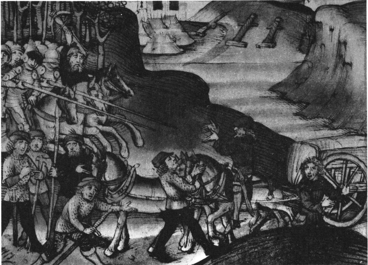
Reisende Kaufleute werden anlässlich einer Fehde überfallen. Nach der Spiezer Chronik des Diebold Schilling, Taf. 175

fangen oder zu vertreiben. Wegen der Banditengefahr schlossen sich die Reisenden häufig zu grösseren Gruppen zusammen und heuerten ein paar Soldknechte an, um sich bei Überfällen besser verteidigen zu können.