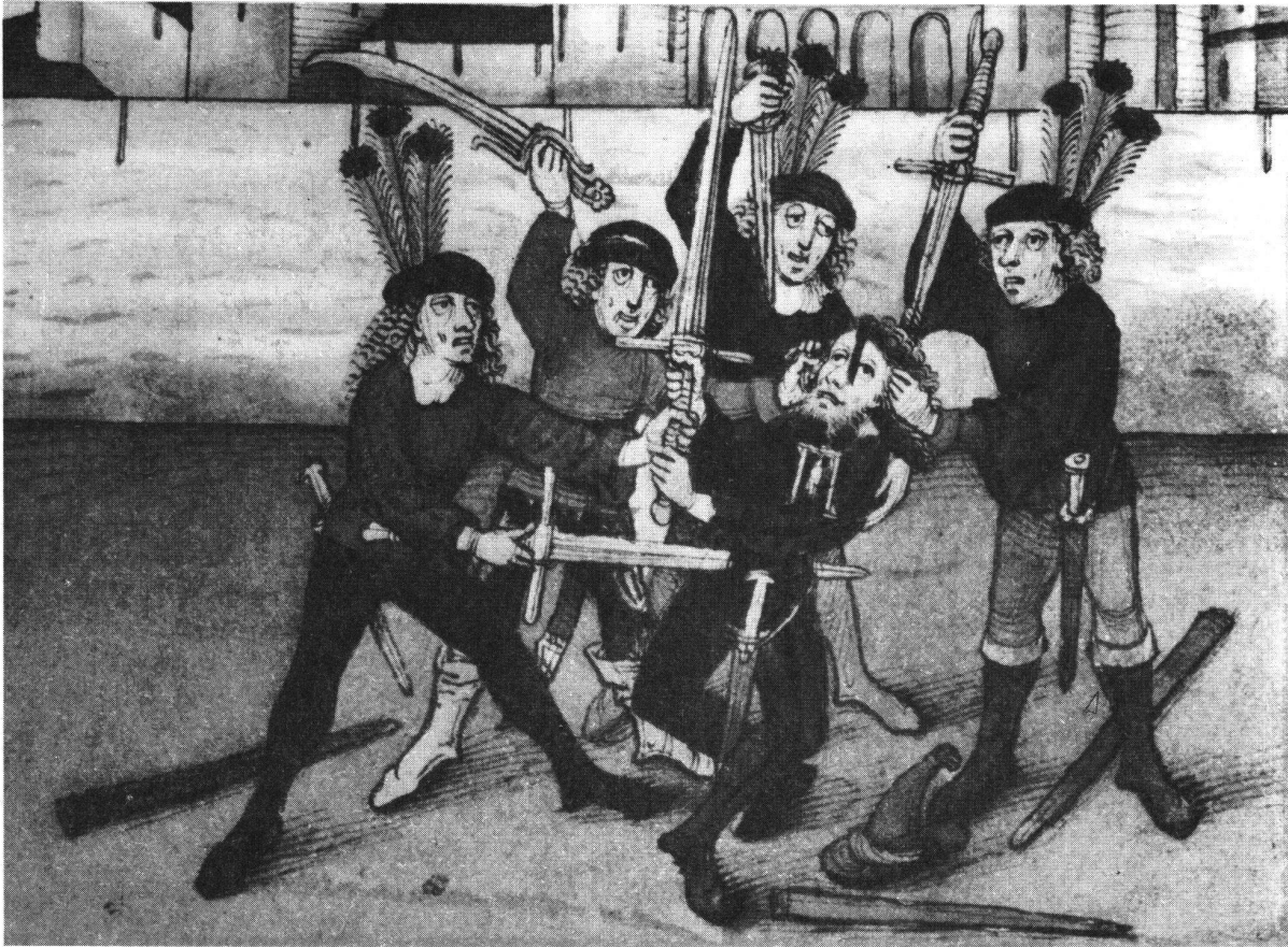
Blutrachemord. Angeworbene Söldner aus dem Wallis erschlagen den Henker von Bern. Nach der Spiezer Chronik des Diebold Schilling, Taf. 328

Privatkrieg. Einen Staat im heutigen Sinne des Wortes hat es im Mittelalter nicht gegeben, und die Gerichte, soweit solche überhaupt bestanden und als zuständig galten, hatten oft Mühe, ihrem Urteilsspruch Achtung zu verschaffen, und mussten den Vollzug des Urteils dem Kläger selbst überlassen. Diesem blieb, wenn der Beklagte den Richterspruch nicht anerkennen wollte, nichts anderes übrig, als seine vom Gericht anerkannten Forderungen mit Hilfe eines privaten Krieges, einer Fehde, durchzusetzen. Wegen ihrer mangelnden Autorität wurden die Gerichte in vielen Fällen überhaupt nicht bemüht, sondern der Geschädigte suchte sein Recht von vornherein in der Fehde. Deren Ausmass hing von der Bedeutung der Streitsache, von der Anzahl und dem Rang der beteiligten Personen und der räumlichen Ausdehnung des Konfliktes ab. Getragen wurde die Fehde von den Rechtsvorstellungen der Wiedergutmachung einerseits und der persönlichen Genugtuung, der Rache, andererseits. Bei der ausserordentlichen Empfindlichkeit des mittelalterlichen Menschen auf ehrenrührige Äusserungen kann es nicht befremden, dass auch Ehrverletzungen den Anlass zu Fehden bilden konnten und dass umgekehrt im Falle einer Rechtsverletzung irgendwelcher Art der Geschädigte eine moralische Verpflichtung hatte, die Tat zu rächen, wollte er seine Ehre nicht verlieren.