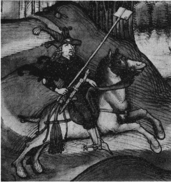
Der reitende Bote des Grafen von Valangin bringt den Bernern den Absagebrief. Nach der Spiezer Chronik des Diebold Schilling, Taf. 112