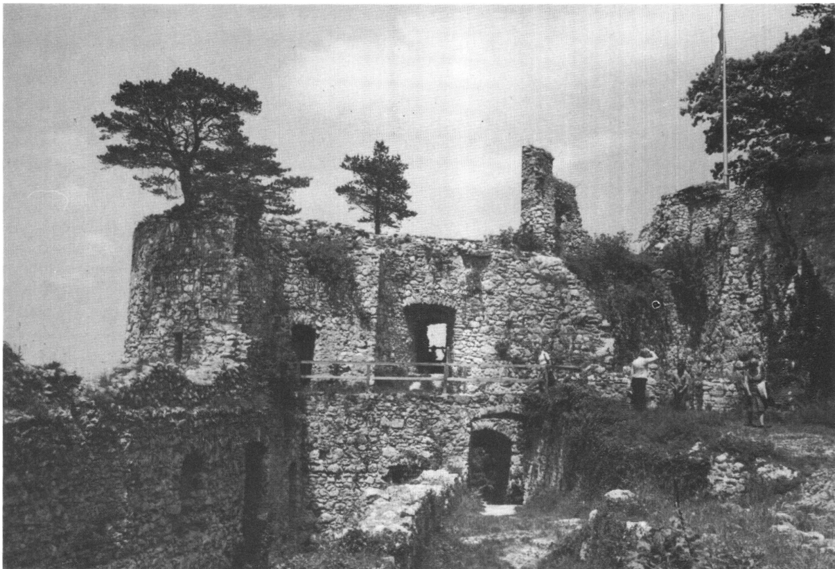
Dorneck SO. Inneres. Blick gegen Süden.