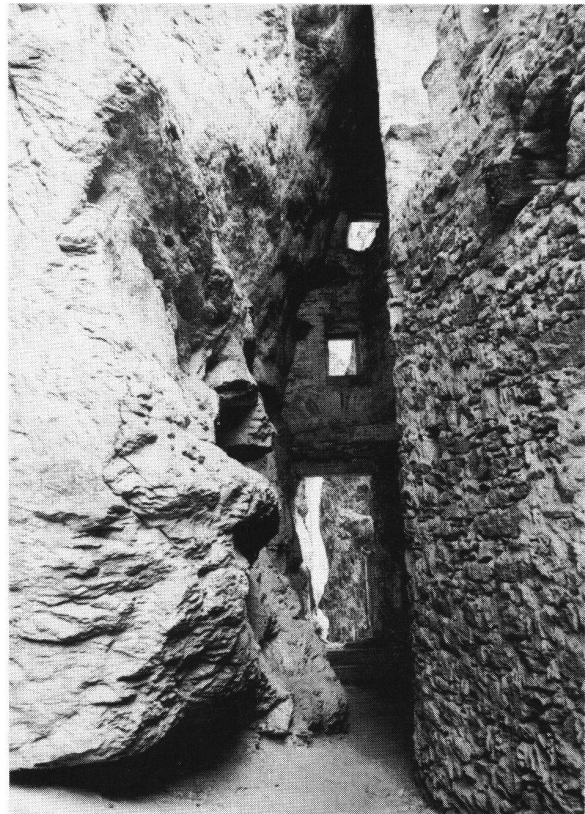
Kropfenstein GR. Inneres der Höhlenburg.

Die Exkursionen hatten das Ziel, den ausländischen Kongressteilnehmern den Burgenbau im Basler Raum in der ganzen Vielfalt und Eigenart vor Augen zu führen. Die erste Ausfahrt ging ins Birstal, wo die gewaltige Anlage von Pfeffingen BL und die zwischen 1960 und 1965 vollständig ausgegrabene und konservierte Ruine Löwenburg besichtigt wurden. Grosse Beachtung fanden die im Lokalmuseum des Hofgutes Löwenburg ausgestellten Kleinfunde mittelalterlicher Zeitstellung. Die zweite Exkursion führte ins Birseck und ins untere Baselbiet. Der erste Besuch galt der Burgruine Dorneck SO, dann zeigte der Baselbieter Kantonsarchäologe Dr. Jürg Ewald den Teilnehmern seine jüngsten Burgengrabungen, wobei er gleich auch die wichtigsten Fundgegenstände vorlegte. Zuerst erstieg man den Felsen von Alt-Schauenburg, und dann erfolgte die Besichtigung der noch laufenden Ausgrabungen auf Burghalden bei Liestal. Den Abschluss der Exkursion bildete die Besichtigung der einstigen Wasserburg Pratteln. Die dritte Ausfahrt war den Burgen am Solothurner Jurasüdfuss gewidmet. Zuerst begaben sich die Teilnehmer auf die Frohburg, wo sie die jüngst fertiggestellten Ausgrabungs- und Konservierungsarbeiten besichtigen konnten. Als nächste Station wurde die Burganlage von Rickenbach im Gäu besucht und als drittes