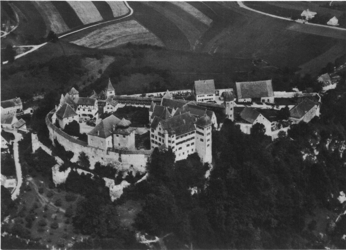
Schloss Harburg, wird am Mittwoch, 1.10.80, besucht werden.