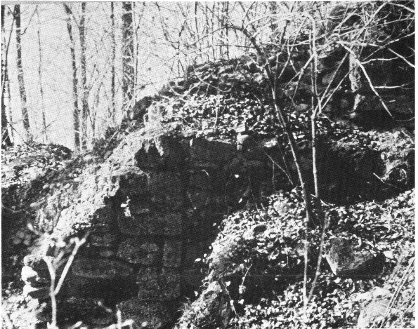
Ausgegrabenes Mauerwerk der Hasenburg

durch den Landesherrn, den Herzog von Österreich, erfolgte oder ob dies durch die Hasenburger geschah, steht bis heute offen und dürfte bis zur Herausgabe der neuen Stadtgeschichte erforscht sein.