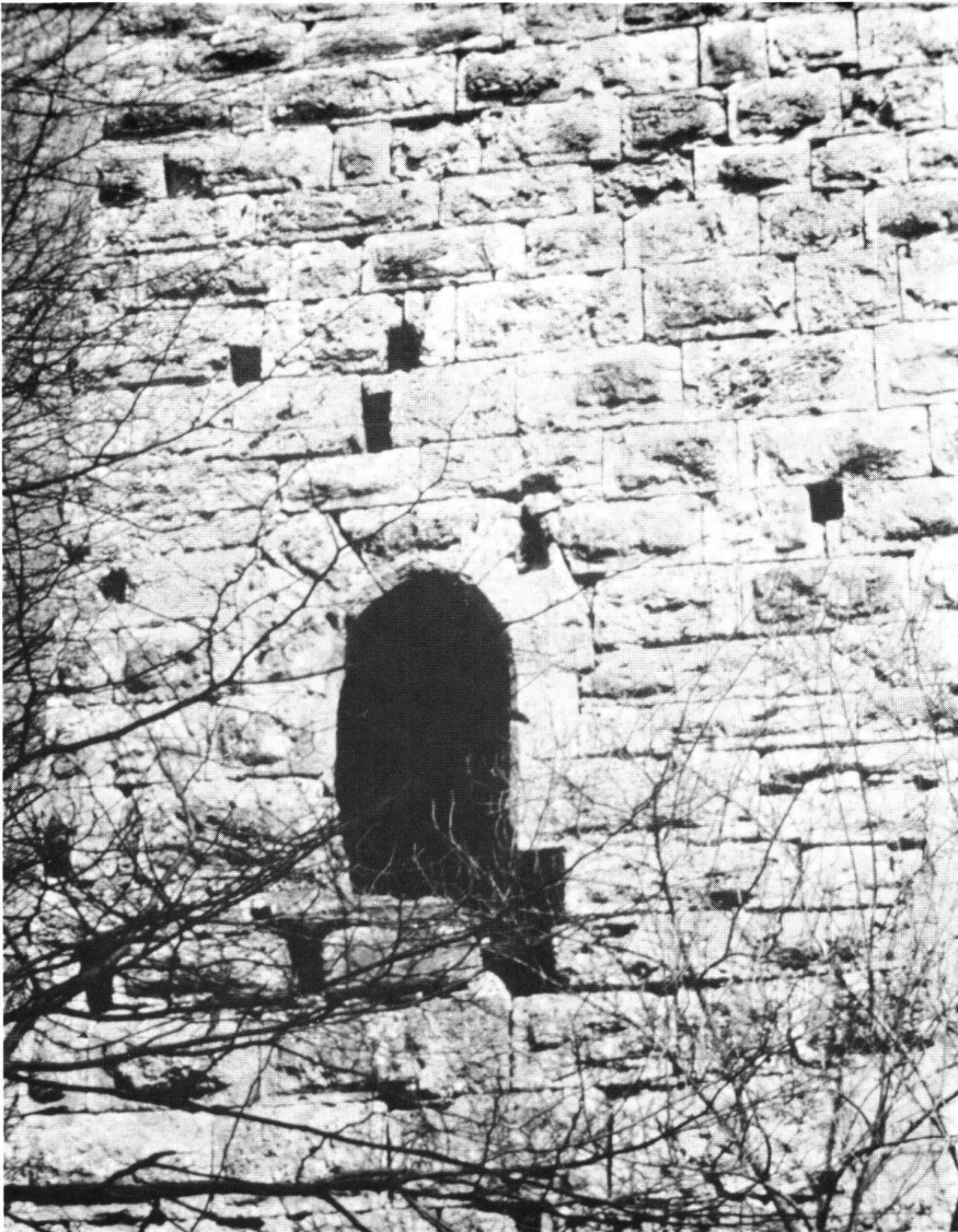
Burg Kasteln, Hocheingang

den andern Burgstellen kein aufragendes Mauerwerk zu finden. Und die schön gefügten Tuffquadern von Kasteln drohen auseinanderzufallen, wenn nicht sofort mit der Erhaltung der Burg vorwärts gemacht wird.