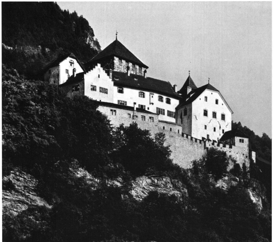
▼ Schloss Maienfeld, Zustand um 1930