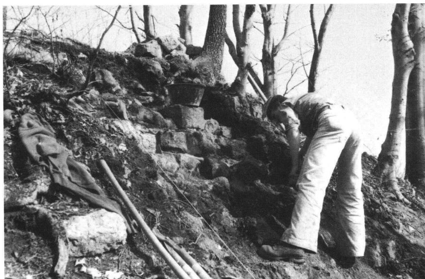
Altenberg BL, Freilegung des Mauerwerks in Schnitt F10.

pauschalen urkundlichen Nennung schwer fassbaren Burgengründungen des Bischofs Burkart von Fenis († 1107) gehören könnte 10 . Diese Anlagen sind während des Investiturstreites entstanden und dürften im 12. Jahrhundert wegen des Überganges der bischöflichen Herrschaftsrechte an regionale Machthaber hochadligen Standes bald wieder eingegangen sein 11 . Abschliessende Aussagen sind in dieser Frage selbstverständlich noch nicht möglich. Dass eine Weiterführung der Grabungen auf dem Altenberg von höchstem burgenkundlichem und historischem Interesse wäre, dürfte durch die bisherigen Forschungsergebnisse hinlänglich klar geworden sein.