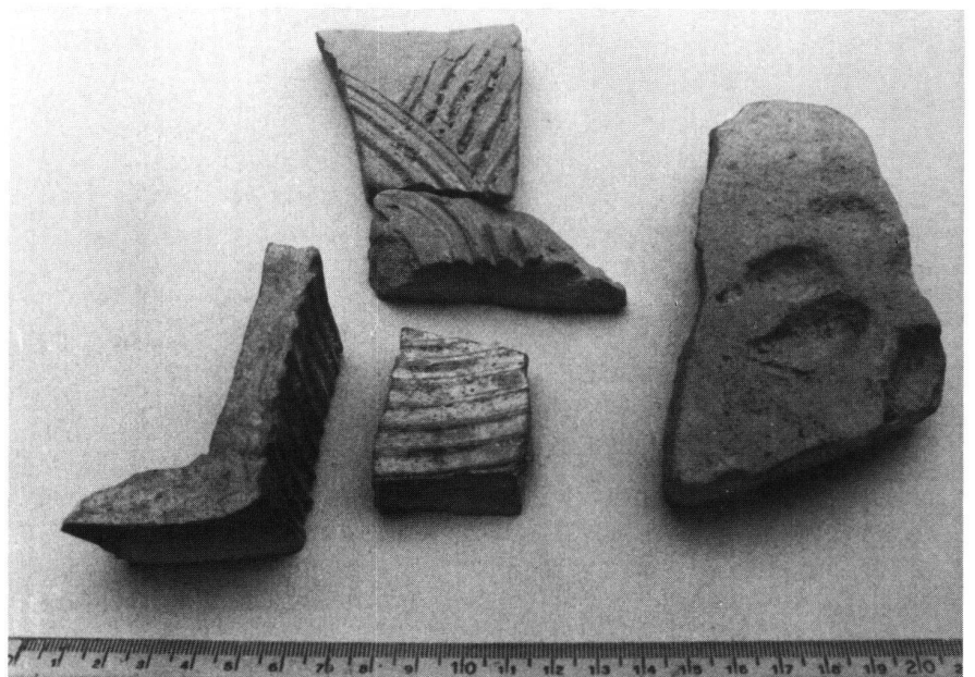
Fragmente von Hypokauströhren, daneben Flachziegel mit Hundepfotenabdruck