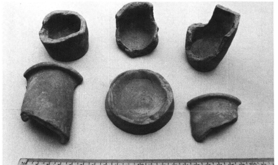
Boden- und Randfragmente von Topf- und Becherkacheln (alle 12. Jh.)