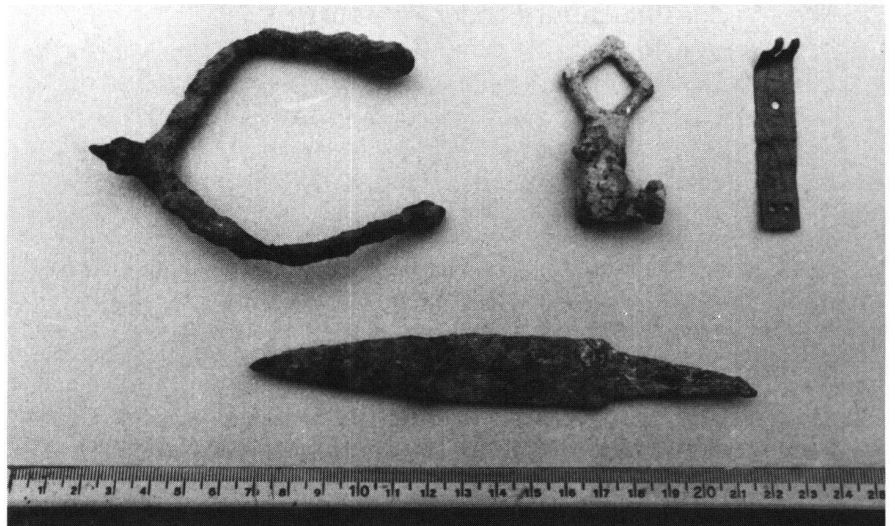
Sporen (vermutl. 13. Jh.), Messer (wohl 12. Jh.), Schlüssel (wohl 13. Jh.), Verschlussblech.