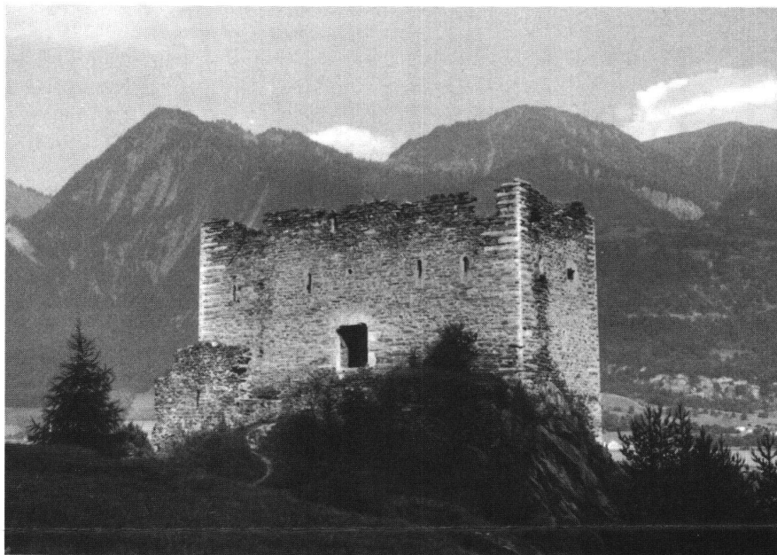
Neuenburg, heutiger Zustand

Eine der schönsten Burgenwanderungen der Schweiz führt von Chur auf dem wilden linken Rheinufer nach Untervaz, wo die stolze Neuenburg (oder Neuburg) den grossartigen Schlusspunkt bildet.