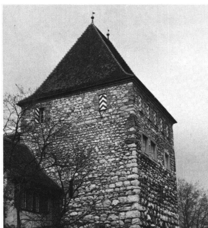
Aarau, Schlössli. Mächtiger Megalithturm. Seine Entstehungszeit fällt mit der Gründung der Stadt Aarau um 1240 zusammen.

Das Museum ist offen von Dienstag bis Freitag 14–17 Uhr, am Donnerstag zusätzlich von 19–21 Uhr sowie an Samstagen und Sonntagen von 10–12 und 14–17 Uhr. Montag geschlossen.