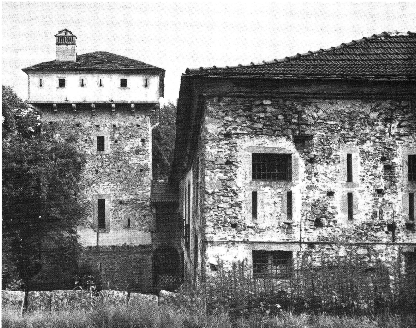
Casa di Ferro, Minusio.

Herren dem Zerfall preisgegeben, weil sich ihr Unterhalt nicht zu lohnen schien, andere sind geschleift worden, damit sie als Stützpunkte eines Gegners ausser Betracht fielen. Unter der Herrschaft der eidgenössischen Landvögte sind im Tessin keine neuen Festungswerke entstanden, und auch die bestehenden Anlagen wurden der Entwicklung der Kriegs- und Belagerungstechnik nicht mehr angepasst. Dagegen sind noch im 16. und 17. Jahrhundert von vornehmen, reichen Privatleuten repräsentative Schlossbauten errichtet worden, bei denen Zinnen, Erker und sonstige Elemente mittelalterlicher Wehrarchitektur in dekorativer Anordnung Verwendung fanden. Mit den schlossartigen Herrensitzen vom Typus der Casa di Ferro bei Minusio oder des Castello dei Marcacci zu Brione klang in den «ennetbirgischen Vogteien» der mittelalterliche Burgenbau aus.