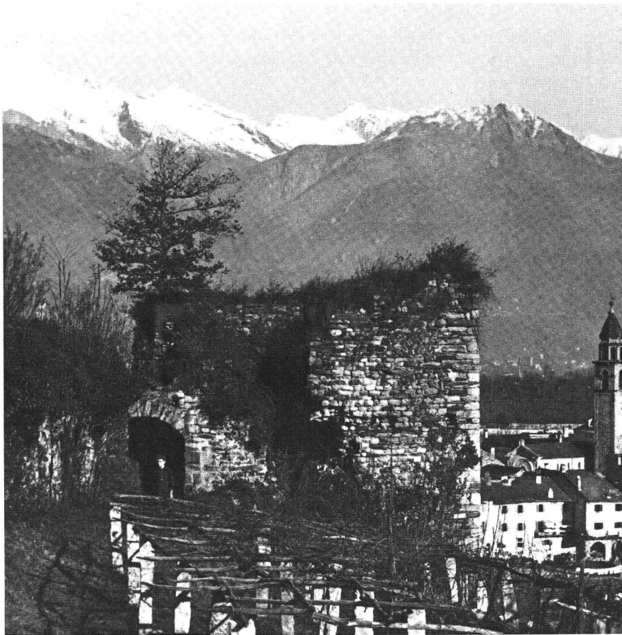
Ascona, Castello S. Michele, Ansicht des 1912 abgebrochenen Eckturmes.