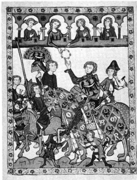
Auftritt zum Turnier. Manessische Liederhandschrift.

Zu einem Turnier strömen Hunderte, bisweilen Tausende von Menschen zusammen. Die Ritter, begleitet von ihren Frauen und Töchtern, umgeben von Gefolge und Gesinde, müssen in standesgemässen Quartieren untergebracht werden, und solche stehen in der benötigten Anzahl nur in grösseren Städten zur Verfügung. Das städtische Gewerbe wird zudem für alle möglichen Dienstleistungen in Anspruch genommen, für die Versorgung mit Lebensmitteln, für das Beschlagen der Pferde und das Reparieren der Turnierausrüstung, für die Pflege der Verletzten und – wofür die jüdischen «Wucherer» benötigt werden – für das Verpfänden von Wertgegenständen. Eine mittelalterliche Stadt, überschwemmt von Turnierteilnehmern, profitiert somit ganz erheblich von der zahlungskräftigen Besucherschaft und präsentiert sich für die einreitenden Gäste im Festtagskleid: Unrat und Misthaufen hat man auf obrigkeitliche Weisung hin entfernt, das Bettelvolk ist weitgehend aus der Stadt vertrieben, die Häuser tragen heraldischen Schmuck aus Fahnen, Wimpeln und Wappenschilden. Provisorische Einrichtungen wie Tribünen, Zelte oder Abschränkungen sind rechtzeitig aufgestellt worden. Turniere können der Obrigkeit allerdings auch Sorgen bereiten. Zum Ausnahmezustand eines mittelalterlichen Festes gehört die Gefahr, dass fröhliche Ausgelassenheit in blutigen Tumult umschlägt, dass aus dem Kampfspiel