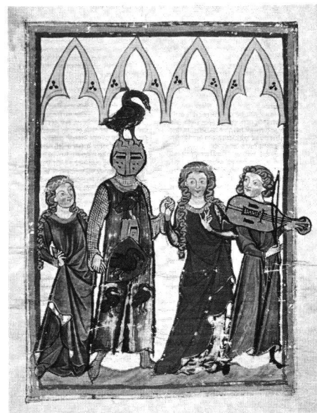
Geharnischter Ritter mit Topfbelm und Wappenkleid beim festlichen Reigentanz. Manessische Liederhandschrift, Anfang 14. Jahrhundert.

Wenn nun im Rahmen eines Festes sportliche Veranstaltungen im weitesten Sinne abgehalten werden, also «Bewegungsspiele» mit oder ohne Wettkampfcharakter, von Reigentänzen über ritualisierte Reiterspiele bis zu blutigen Zweikämpfen, haben wir stets nach der Bedeutung solchen sportlichen Tuns für das Fest (z. B. Unterhaltung, Tapferkeitsbeweis, Initiationsprobe) und umgekehrt nach der Bedeutung des Festes für das sportliche Spiel (z. B. Standesrepräsentation, Wiederholungsritual) zu fragen. Es zeigt sich