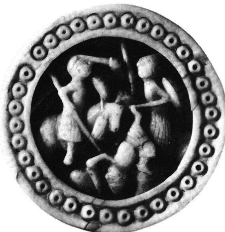
Turnierende Ritter. Brettspielstein aus Elfenbein (Walrosszahn?), 12. Jahrhundert, englisch.

Entscheidend für die kulturgeschichtliche Bedeutung der Veranstaltung von 1184 ist auch gar nicht der messbare Aufwand, sondern die festliche Stimmung, die alle Teilnehmer in Bann geschlagen und durch ihr jähes Ende, verursacht durch ein fürchterliches Unwetter, eine symbolhafte Auslegung – Zerbrechlichkeit des irdischen Glücks – erfahren hat.