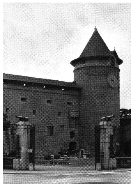
Morges, Donjon und Eingangspartie.