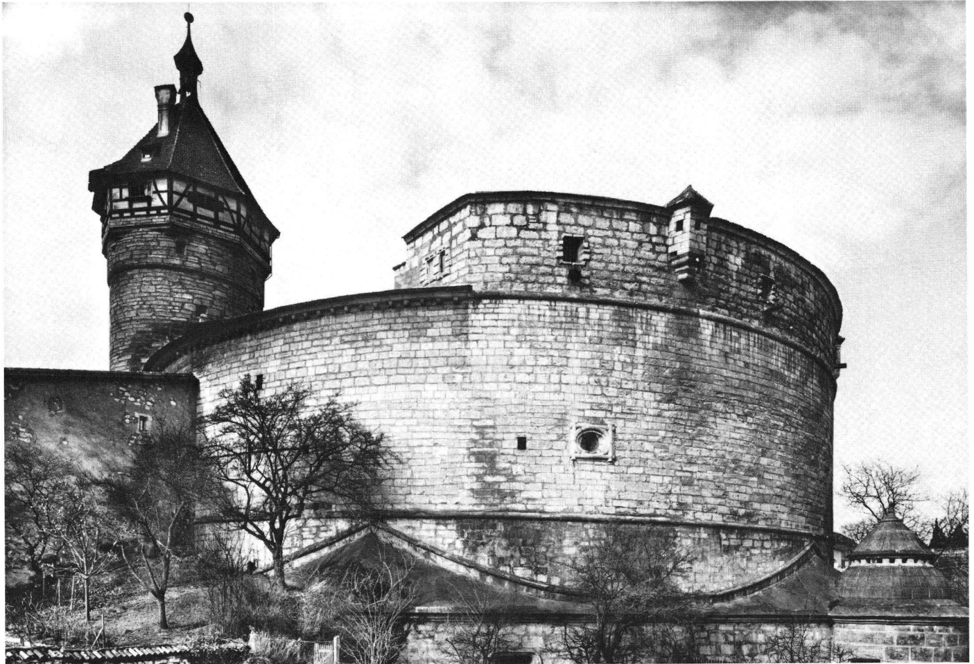
Schaffhausen, Munot, Feldseite.

Pfandschaft loszukaufen und sicherte dadurch der Stadt erneut die Reichsfreiheit. Bis dahin hatte Schaffhausen treu die Farben Österreichs verteidigt, was dazu führte, dass eine Territorialbildung erst spät einsetzen konnte. Nachdem 1080 das weltliche Stadtre Regiment sich formell in ein geistliches verwandelt hatte – damals wurde die Stadt dem jungen Kloster geschenkt –, war die Entwicklung bereits im 12. Jahrhundert rückläufig, und Stadt und Stadtherrin traten in Gegensatz zueinander. Schon 1253 besass die Bürgerschaft ihr eigenes Siegel: «Sigillum civium in Schafusa». Aber immer noch bildeten weltliche Adelige und hohe kirchliche Institutionen Inhaber von Boden, Leuten und Rechten im Interessenbereich der Stadt und waren damit Konkurrenten. Als adelige Lehensträger seien u. a. erwähnt die Herzöge von Teck, die Grafen von Nellenburg-Veringen, von Habsburg, von Kyburg, von Fürstenberg sowie die Freiherren von Lupfen-Stühlingen, von Tengen, von Krenkingen, von Wartenberg. Auch der Ministerialadel stand im Wettstreit mit den Kaufleuten und