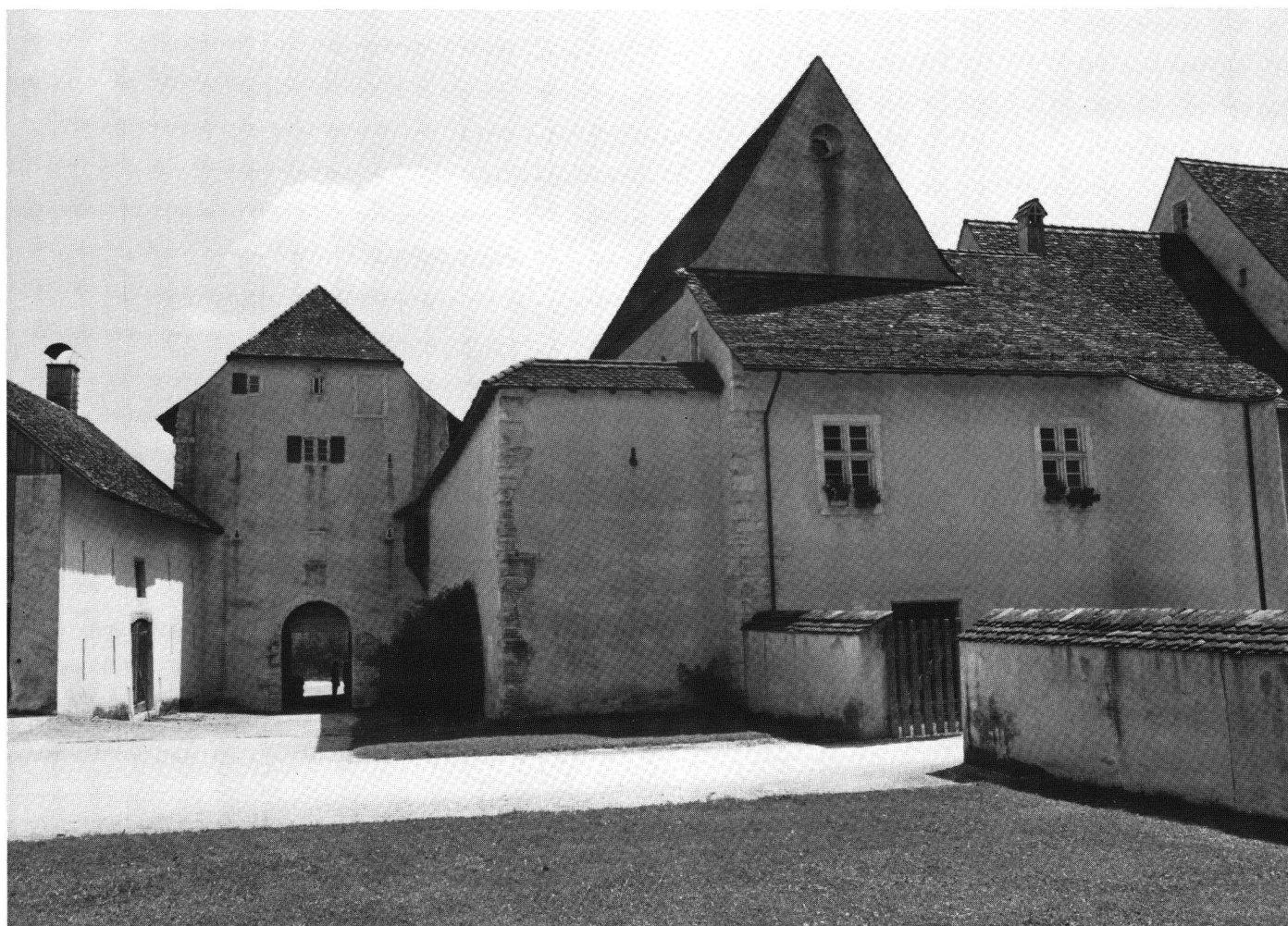
Löwenburg (JU), befestigte Eingangspartie zum Gutshof.

37 Für Hinweise auf unvollendete Burgplätze in Belgien und in den Niederlanden dankt der Autor den Kollegen A. Matthys (Brüssel) und J. Renaud (Amersfoort).