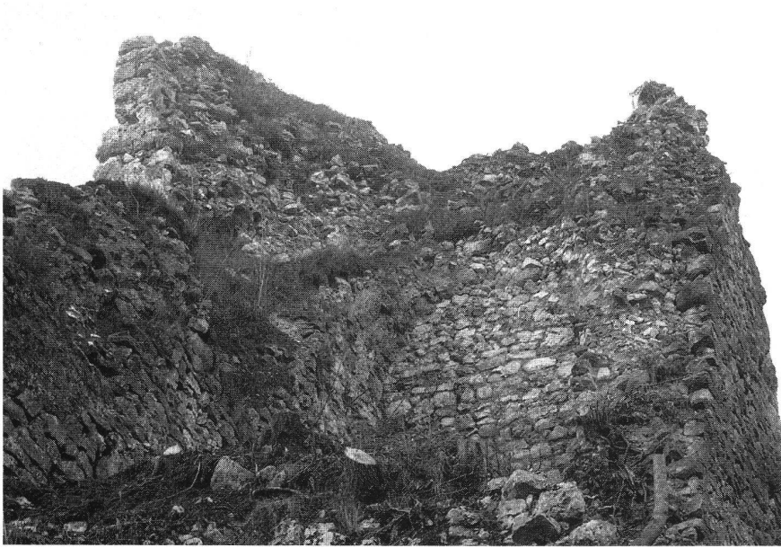
Château de Vorbourg, maçonnerie du château supérieur.