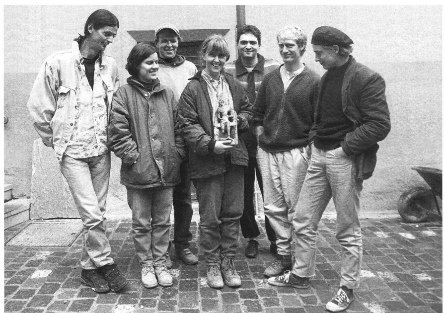
3: Chur, Martinsplatz 1995. Gruppenfoto nach dem Bergen der ersten Nischenkranzkachel.

Bei zwei Exemplaren handelt es sich um Reste von unglasierten Napfwandungen, welche keine weiteren Aussagen zulassen. Das dritte