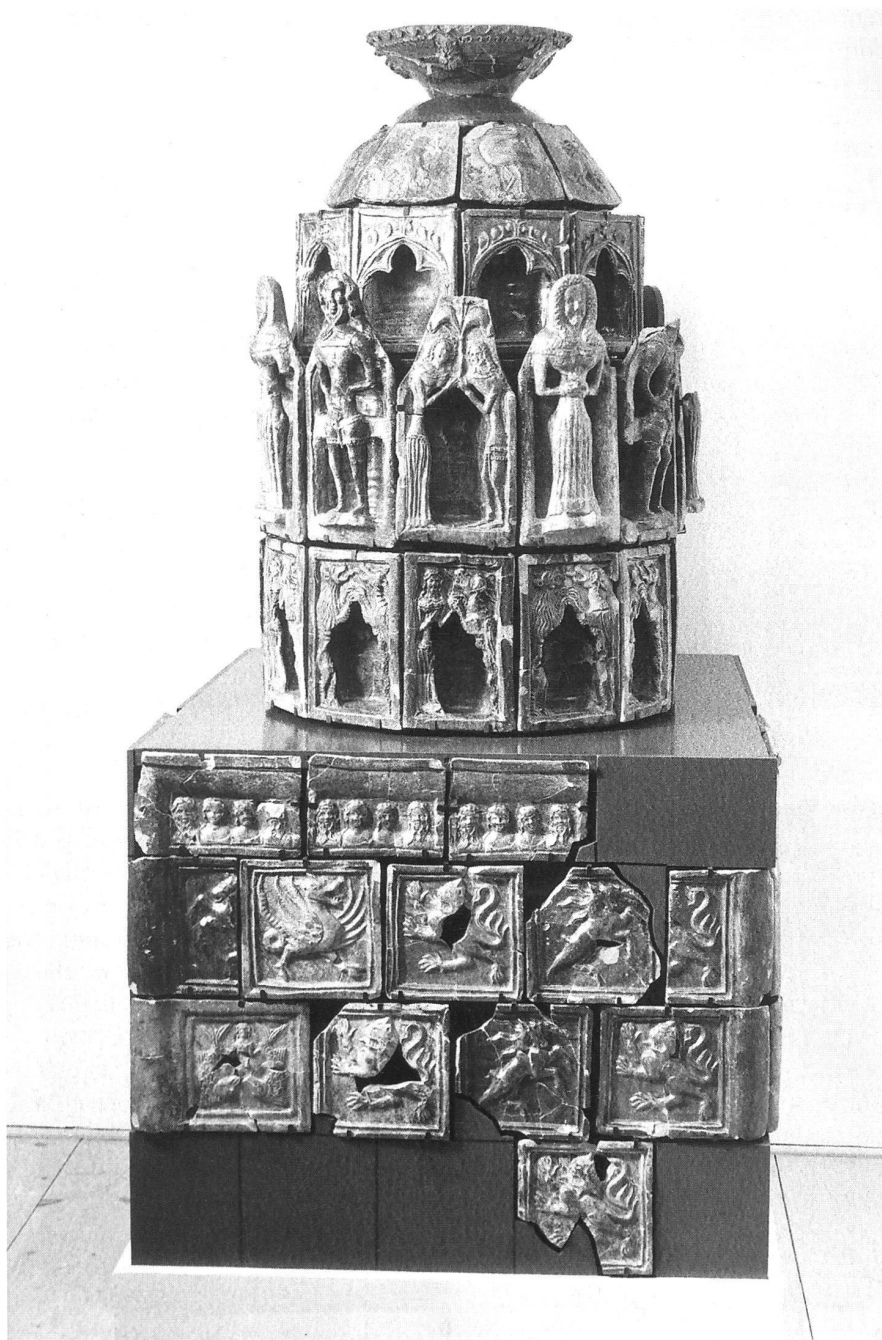
9: Chur, Martinsplatz 1995. Versuch einer Ofenrekonstruktion in Originalgrösse unter Verwendung der Kacheln aus dem Depot.

Für das Ofenmodell wurden 56 Kacheln verwendet, was 80% des