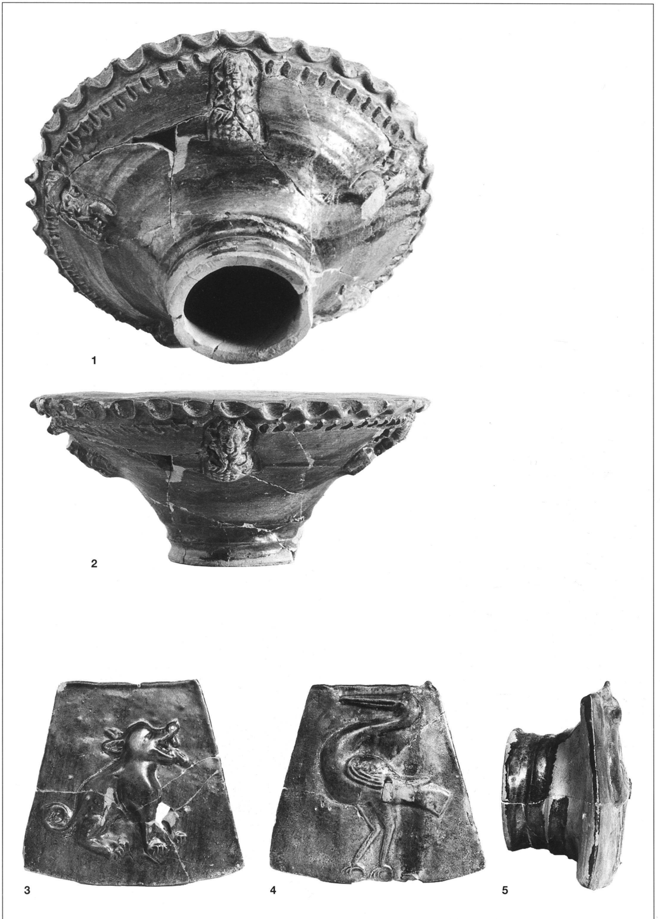
4: Chur, Martinsplatz 1995. Bildtafel mit Kacheln aus dem Depot. M. 1:2,5.