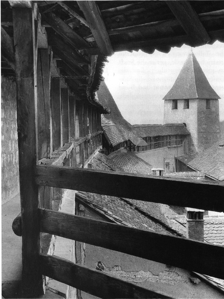
3: Blick in den Wehrgang des 15. und 16. Jhs., Sektoren X/XI (Foto Wildanger 1930er Jahre).

der Hexerei angeklagt waren. Der Kasten wurde 1763 entfernt.