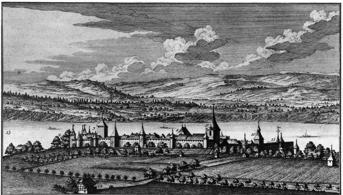
N. Schor fecit. 1755.

Mit Ausnahme der beiden seit der Mitte des 13. Jhs. erwähnten Stadttore (3, 15) sind die Befestigungstürme erst seit dem späten 14. Jh. aktenkundig. Das Ryftor (17) und die Portierla (15), der Durchgang im Rathaus mit Tür und Treppe zur Ryf, sind seit 1439 erwähnt und spätestens im 14. Jh. entstanden. Das «Törli», der kleine, ursprünglich türbreite Stadtausgang auf der Südseite der Kreuzgasse (IX) 2 , wur-