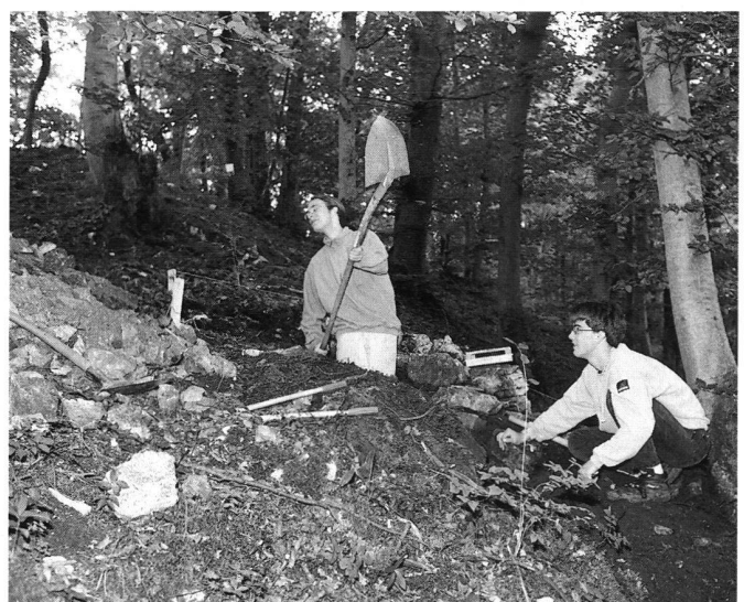
8: Riniken, Ruine Iberg. Ausgrabung 1997. Schüler und Schülerinnen der Kantonschule Zofingen an der Arbeit.