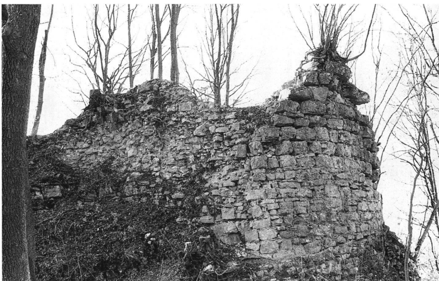
5: Densbüren, Ruine Urgiz (1996). Der Mauermantel des Rundturms ist teilweise in den Graben gestürzt.