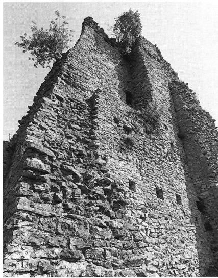
1: Thalheim, Ruine Schenkenberg. Sie wartet seit 30 Jahren auf eine nächste Sanierungsetappe.

Die attraktivste Ruine im Kanton Aargau ist zweifellos die Ruine Schenkenberg. In den 70er Jahren wurden die Mauern konserviert. Nach ca. 30 Jahren wäre nun eine Nachkonservierung dringend notwendig. Leider ist es bis heute nicht gelungen, die nötigen Mittel aufzutreiben, um die Mauern dieser