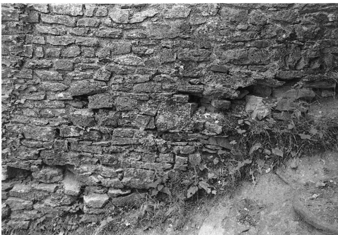
2: Thalheim, Ruine Schenkenberg. Schadensbild im Fundamentbereich.

Meistens handelte die aargauische Kantonsarchäologie in den letzten Jahren nicht aus eigenem Antrieb oder gar aus der Kenntnis einer systematischen Ruinenüberwachung. Die Initiative lag bei den sanierungswilligen Privaten, Gemeinden und Städten (Abb. 7). Neben der wissenschaftlichen Betreuung, bemüht sich die Kantonsarchäologie auch um die Subventionen, um den Beizug von Bundesexperten oder um das Erstellen von Gutachten z.B. zur Mörtelbeschaffenheit oder zum geologischen Untergrund. Besonders arbeitsintensiv sind für die Kantonsarchäologie die Grabungen und Bauuntersuchungen von Objekten, die im Besitz des Kantons sind, wie z.B. Schloss Lenzburg, Schloss Habsburg, Schloss Hallwyl, Schloss Liebegg. Meistens handelt es sich hier um grössere Sanierungsprojekte, bei denen die künftige Nutzung der Gebäude die Bauarbeiten stark beeinflusst.