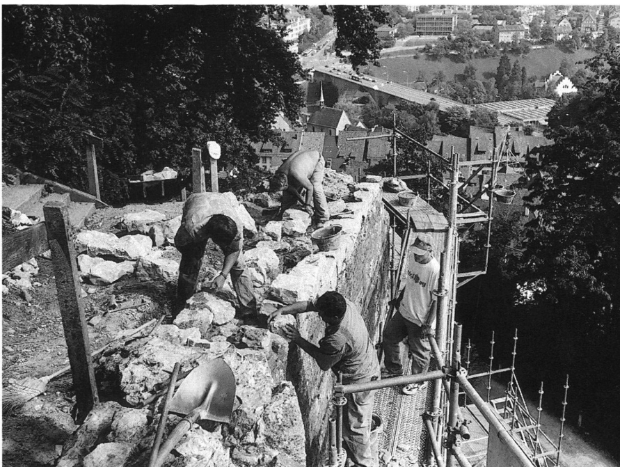
10: Baden, Ruine Stein (1998). Handwerker an der Arbeit.