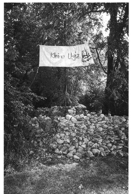
13: Densbüren, Ruine Urgiz. Den Kindern des benachbarten Bauernhofes ist auf «Kleinurgiz» ein Obolus zu entrichten.

möglich gewesen, die Ruine Urgiz zu sanieren. Die erfolgreiche Restaurierung Ruine Urgiz hat gezeigt, dass ein gezielter Einsatz von Arbeitslosen, ein Projekt finanziell entlasten kann. Allerdings gilt es jeweils abzuwägen, in welchen Fällen dies Sinn macht, denn eine Beschäftigung von Arbeitslosen bedeutet mehr Betreuungsarbeit für die Bauleitung und die Kantonsarchäologie.