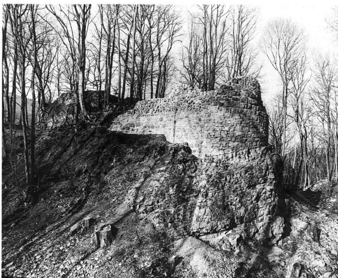
6: Densbüren, Ruine Urgiz (1997). Der Rundturm ist konserviert.