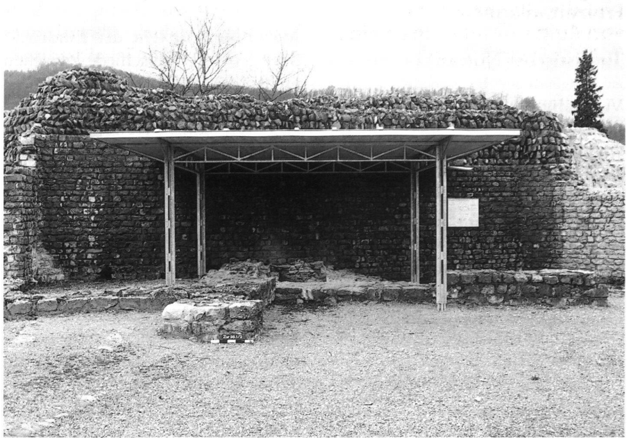
12: Spätromisches Kastell Zurzach (1997). Schutzdach über dem frühchristlichen Taufbecken.

Wie in anderen Kantonen auch, müssen im Kanton Aargau die Eigentümer für die Sanierung und den Unterhalt aufkommen. Ist das Objekt unter Schutz, erhalten die Eigentümer – bei den Burgen sind das in der Regel die Gemeinden – vom Kanton und von der Eidgenossenschaft Subventionen. Die Ruinen schlummern meistens abgelegen im Wald und werden erst wieder entdeckt, wenn entweder