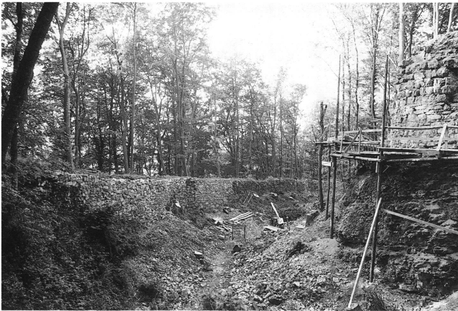
9: Densbüren, Ruine Urgiz (1997). Blick an den eingerüsteten Fels mit dem Rundturm.

Über das Gefahrenpotential eines geologischen Untergrundes einer Burg haben wir Archäologen und Archäologinnen eine laienhafte Vorstellung. Ob der Felsgrund intakt ist, kann seriös nur ein geologisches Gutachten beantworten. Einige aargauische Burgen befinden sich an Standorten, bei denen es sich lohnt im Voraus abzuklären, wie gefährlich der Felsgrund nun wirklich ist. Zum Beispiel schien