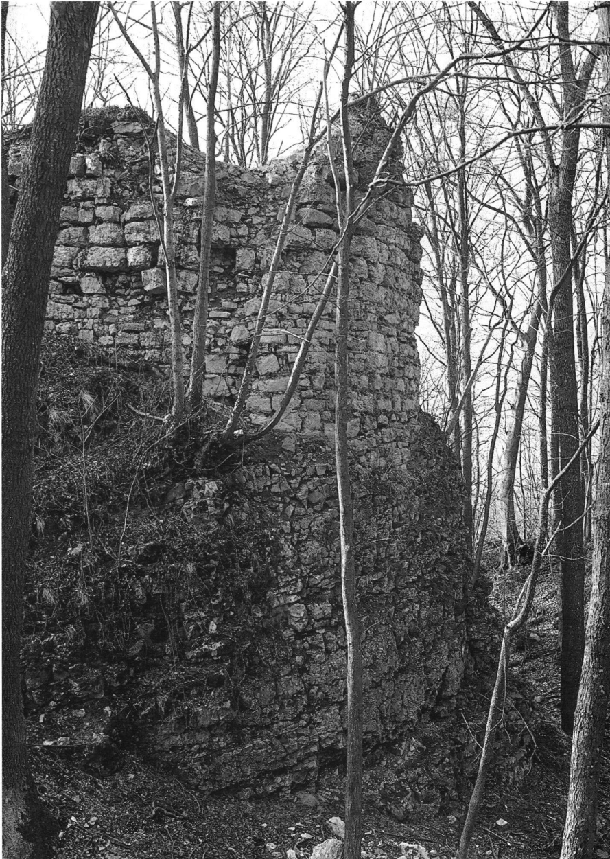
4: Densbüren, Ruine Urgiz (1982). Der Mauermantel des Rundturms ist noch weitgehend erhalten.

Grundsätzlich unterstützen wir ein Restaurieren in ruinenadäquater Form (z.B. Bruchsteinmauern mit Bruchsteinen, Bollensteinmauern mit Bollensteinen). Die Restaurie-