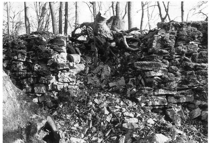
3: Densbüren, Ruine Urgiz (1996). In der Trockenmauer des Burggrabens sind an mehreren Stellen über die Jahre grosse Schäden entstanden.