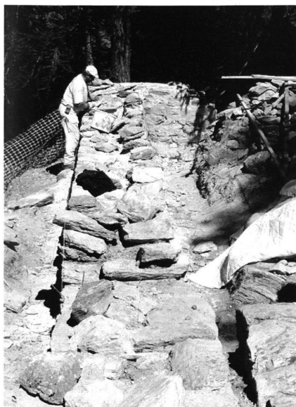
Die Schildmauer wächst.

Müstair, Ruina Balcun At/Hohenbalken. Feldaufnahme im Massstab 1:500, Flächentopografie innert 4 Tagen, Vorarbeiten mit Geländebegehung 1 Tag, Umzeichnung zum Reinplan 3 Tage, Auswertung der Feldaufnahme mit den untersuchten archäologischen Bodeneingriffen 2 Tage.