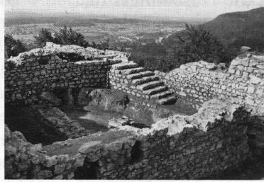
Bericht über die Forschungen 1966/67