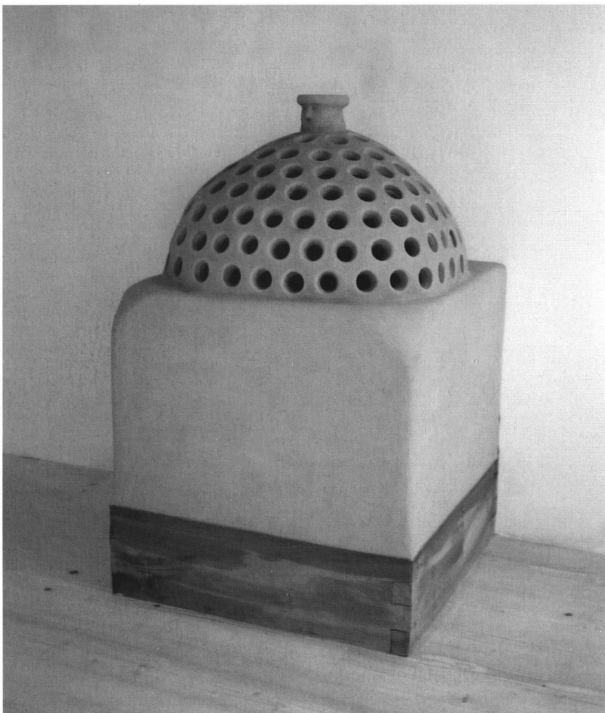
3: Der Kachelofen nach seiner Fertigstellung. Das Aussehen beruht auf Funden und Befunden des 1208 an der Winterthurer Metzggasse gebauten Ofens, als Abschluss wurde eine Replik des aus Lehm modellierten Kopfes der Winterthurer Obergasse 4 eingesetzt.