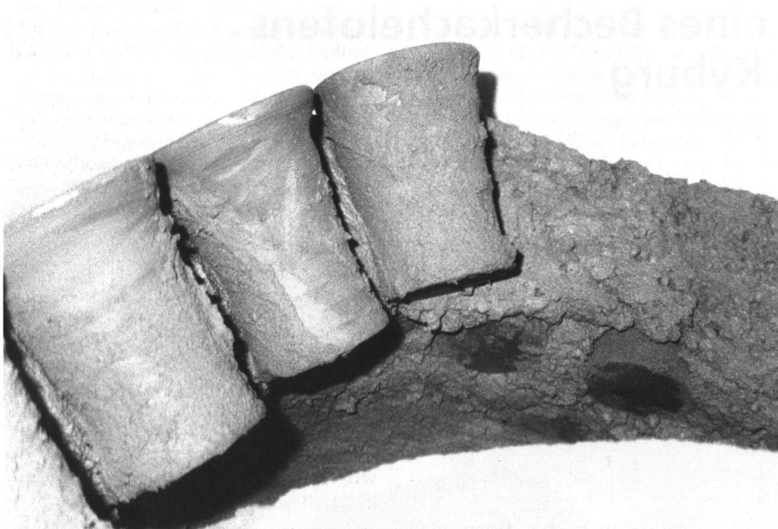
2: Nach dem Setzen der Kacheln müssen die Zwischenräume mit Lehm gefüllt werden.