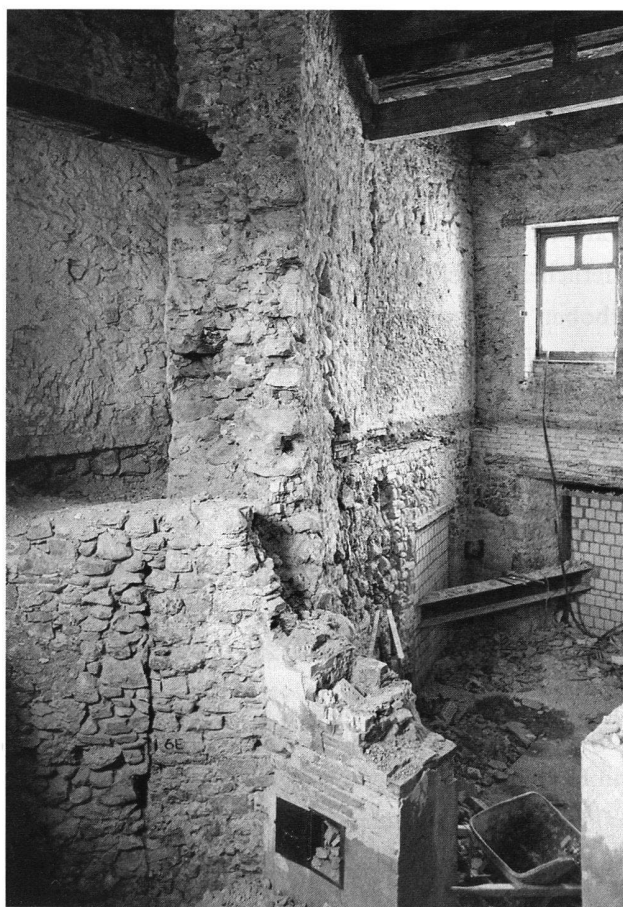
10: Burg Zug. Mantelmauerreste im Ostannex während der Umbauarbeiten 1979.