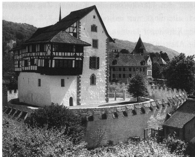
9: Die Burg Zug 1986. Blick von Nordwesten.

Anlässlich der Vorarbeiten zur Ausstellung «Aus den Anfängen der Burg Zug» zum zehnjährigen Jubiläum des Museums in der Burg 1992 kam der Verdacht auf, dass die runde Mauer erstens älter als der Turm des frühen 13. Jahrhunderts ist und zweitens keine Schildmauer gewesen sein kann. Erst die vergleichende Auslegeordnung der Profilzeichnungen im Rahmen der Gesamtauswertung der Grabungen erlaubte es, die runde Mauer in einen sinnvollen Zusammenhang mit dem übrigen Gebäude zu bringen: Nordwestlich des Turmes sind an drei Stellen Mauergruben dokumentiert, die auf Grund ihrer Breite und ihres Unterkantenniveaus bestens zu ihr passen. Einzelne Steingruppen, die 1979 südwestlich des Turmes dokumentiert wurden, setzen die Mauer weiter fort (Abb. 10). Diese Befunde