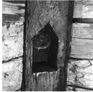
27: Hünenberg, Burgstrasse (abgebrochen, Foto 2001). Nische im Eckständer der Stube, sogenannter Herrgottswinkel, datiert 1598.

Haus auf der südlichen Giebelseite einen weiteren, ähnlich organisierten Wohnteil.