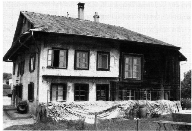
24: Traufbetontes Wohnhaus «Merzenstein» in Friesenham, datiert 1464, der Anbau stammt von 1475/80. Trauffassade West.

Die Wohnhäuser gliedern sich im einfachsten Fall in einen beheizbaren Wohnraum (Stube), eine Küche und einen ebenerdigen Keller. Belegt sind auch Doppelwohnhäuser und Vielzweckbauten. In groben Zügen lassen sich diese Wohnhäuser zwei Altersschichten zuordnen: der Gruppe der Wohnhäuser, die seit dem