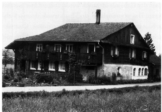
25: Traufbetontes Wohnhaus in Drälikon bei Hünenberg, datiert 1503 (Foto 1987).

15. Jahrhundert nachzuweisen sind und nach der Mitte des 17. Jahrhunderts kaum noch neu erstellt wurden, sowie jener der Vielzweckbauten. Bei Letzteren sind Ökonomie- und Wohnteil unter einem Dach zusammengefasst und die Wohnräume traufseitig ausgerichtet. Vielzweckbauten kommen im Kanton Zug allgemein selten vor und entstanden meist erst im 19. Jahrhundert.